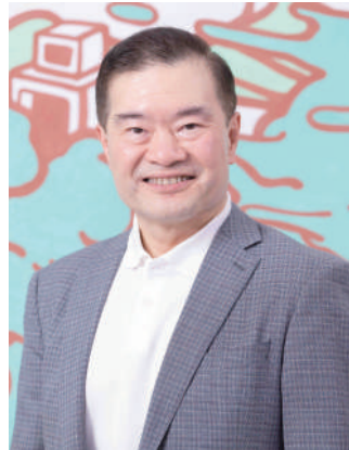
▲原香港數碼港主席及香港創科展評審委員林家禮博士。

香港創新基金共接獲超過400份來自全港140間中小學逾1,200名小四至中六學生提交的作品，分別圍繞智慧城市及智能家居、醫療及保健、可持續發展及奇妙思想四大範疇。早前已進行初審，邀請約30名來自不同行業的專家及學者組成的初選評審團，選出120隊入圍隊伍，包括「小學組」、「初中組」及「高中組」優勝隊伍，將於創科展期間公佈，而「最受歡迎設計大獎」則由公眾