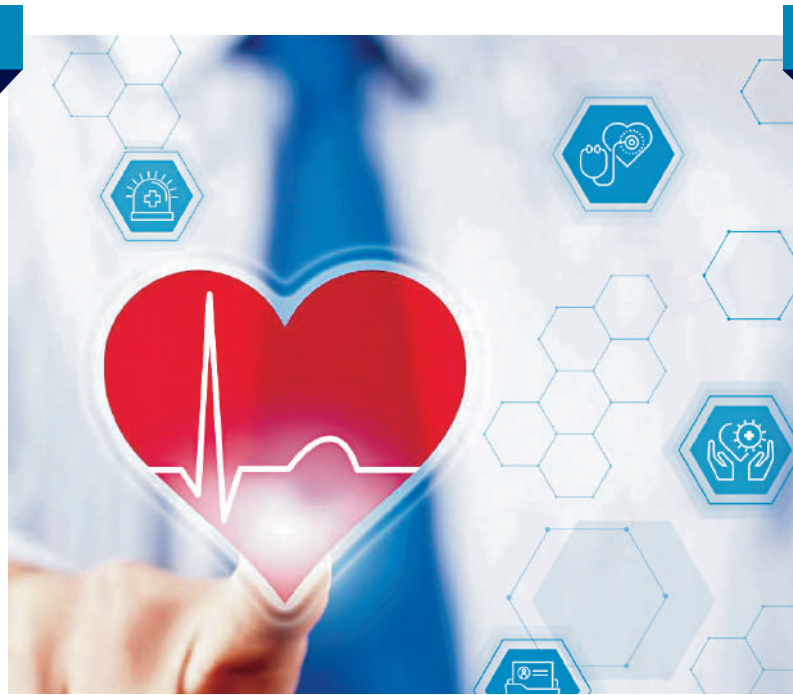
▲內地計劃規管醫藥電商平台經營模式，須選定是銷售自營藥品還是單純做第三方平台。