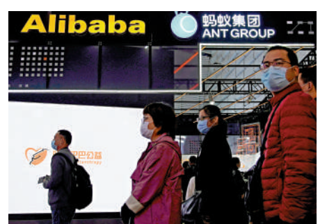
消息指阿里與螞蟻將會限制使用對方的服務，甚至互相爭奪客戶。

螞蟻發言人回應，集團一直按照監管要求推進各項整改工作，包括準備金控申設等相關材料，至於對何時正式提交申請，暫未有時間表。