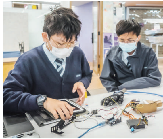
▲學生發揮創意，解決日常生活所遇到的挑戰。