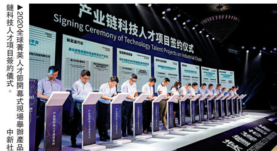
▲2022全球青英人才節開幕式現場舉辦產品鏈科技人才項目簽約儀式。