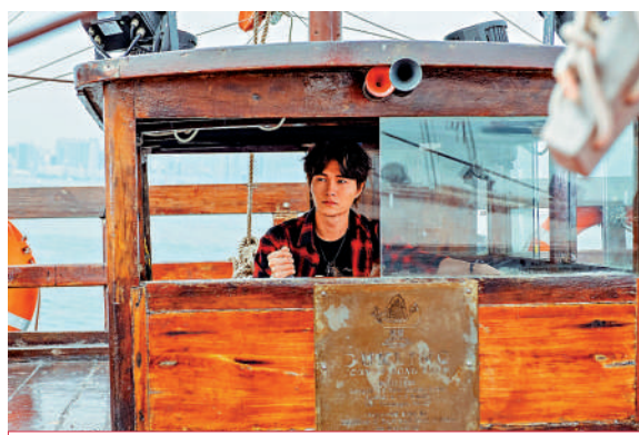
導演：潘梓然 主演：胡鴻鈞、張兆輝、車婉婉、黃梓樂、朱鑑然