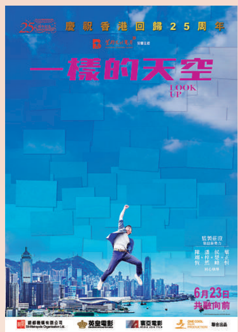
《一樣的天空》電影海報。