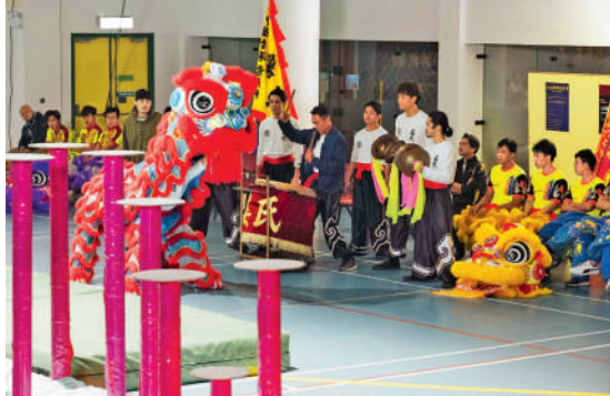
導演：葉正恒 主演：姜皓文、Bipin Karma、麥詠楠、黃溢濠、鄧文正、黎峻