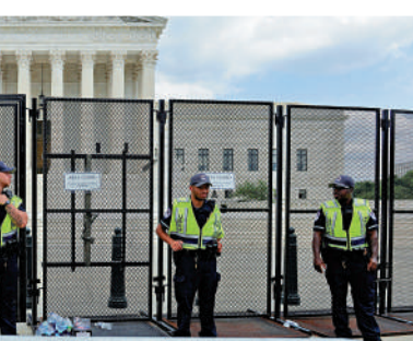
美國最高法院24日已經豎起鐵絲網，警察在場戒備。