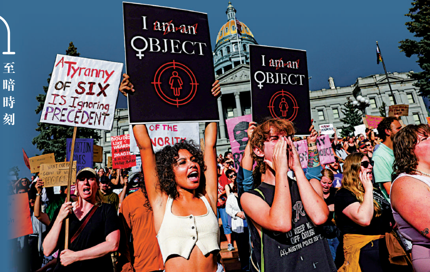
科羅拉多州丹佛市民眾24日示威，抗議最高法院的判決。