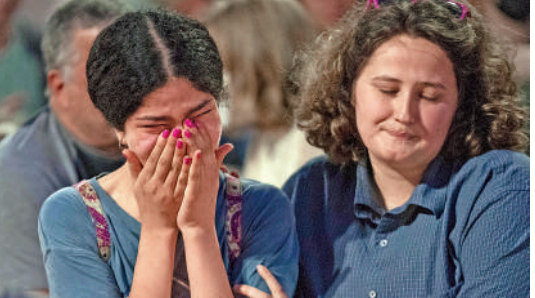
▲美國最高法院的爭議性裁決令美國人權倒退，示威者26日在華盛頓悲傷不已。

美國墮胎的人群中，經濟基礎較差的年輕女性佔比最大。調查顯示，2019年的墮胎通報個案裏，約有57%女性的年齡介在20至29歲之間。同時，美國疾控中心(CDC)所通報的墮胎數據，也因未計入非法墮胎而被大大低估。難以想像這些本處於弱勢群體的女性，在失去墮胎權後將會面臨怎樣的處境。