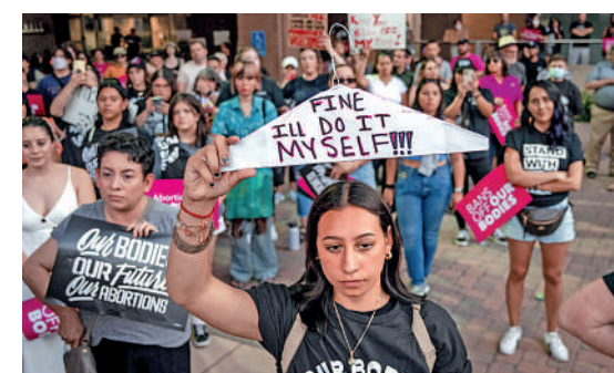
▲在墮胎權被剝奪的情況下，有些女性會選擇自行墮胎，圖為24日在加州的遊行中有人打出相關標語。

醫學期刊《刺針》上月發表的文章指出，當今女性的意外懷孕和流產是普遍現象。全球範圍內，每年約有1.2億次意外懷孕發生，其中五分之一以流產告終。而這些流產中，大約只有55%是安全的。這也就是說，每年有約3300萬婦女接受了不安全的墮胎，她們的生命處於危險之中。