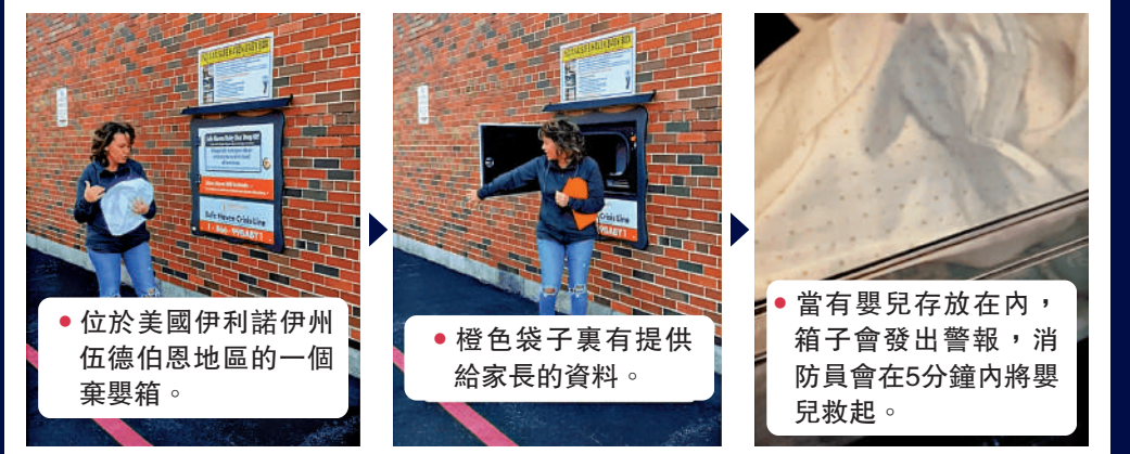
●位於美國伊利諾伊州伍德伯恩地區的一個棄嬰箱。