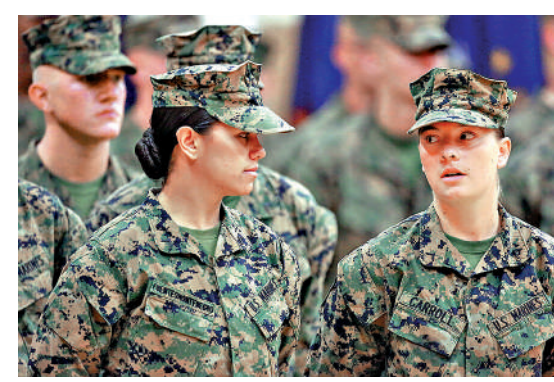
▲墮胎權被推翻，美國女兵面臨更危險的境地。

根據《軍事醫學》雜誌2020年的研究指出，正在服役（尤其是海軍）的女兵，若是在軍隊發生性行為就會被懲處，而這也會影響到她們的職業生涯。