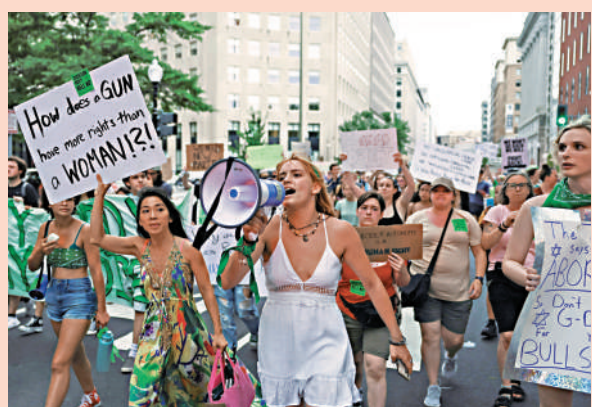
▲美國婦女26日在華盛頓遊行抗議最高法院有關墮胎權的裁決。