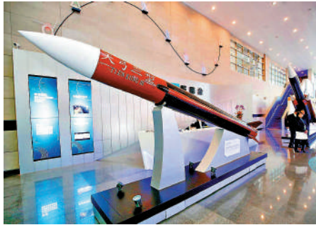
▲專家指出，台灣研製的「天弓三型」導彈難達到預期射程。 網上圖片

【大公報訊】記者蘇榕蓉報道：對於台灣方面將在台北周邊部署「天弓三型」新型防空導彈，軍事專家王雲飛向大公報表示，台島自研的「天弓三型」防空導彈，主要用途是攔截彈道導彈、巡航導彈和各種作戰飛機，對空目標號稱能打200公里，實際上很難達到這個距離，因為其探測距離可能是有限的。目前解放軍軍機空中優勢比較明顯，台灣方面可能感到原有的防空能力很難應付大陸的空中優勢，特別是在台北、桃