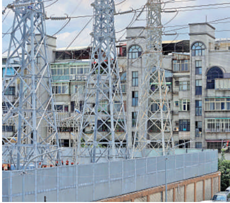
▲國際燃料價格居高不下，台電虧損擴大。台當局27日決定調漲電價。

此外，考量民生物價及通脹壓力，小商店、低壓用戶及高中以下學校的電價將不調漲，住宅用電1000度以下也被排除。住宅用電1000度以上的，超出部分電價調漲9%。台灣電價自2018年4月調漲3%後，4年內未曾調漲。今年國際能源價格持續攀升，讓台電發電成本大增，面臨極大財務壓力，預計前5個月虧損達700億元。