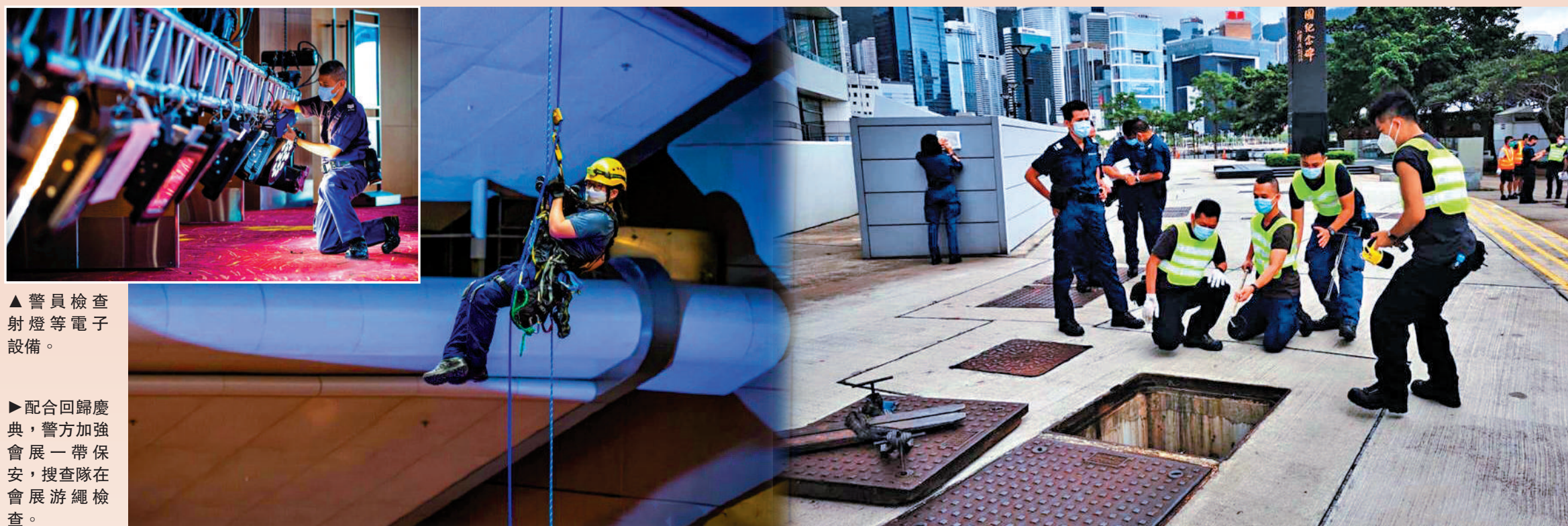
▲警員檢查射燈等電子設備。