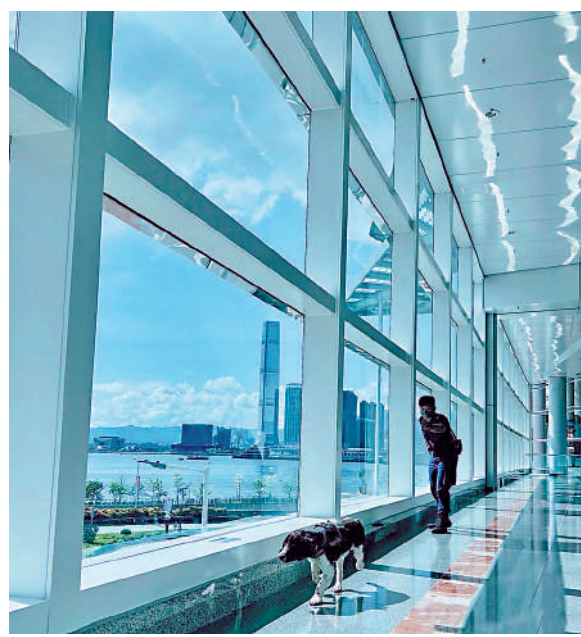
▲警方出動警犬隊參與會展的搜查工作。

【大公報訊】因應中共中央總書記、國家主席、中央軍委主席習近平將出席慶祝香港回歸祖國25周年大會暨香港特別行政區第六屆政府就職典禮，警方為能夠安全及順利進行，特別派出警察搜查隊及警犬隊，在香港會議展覽中心進行詳細搜查。