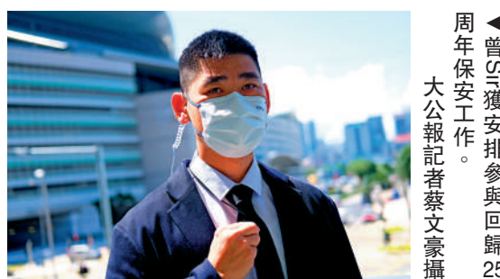
▲曾Sir獲安排參與回歸25周年保安工作。

曾Sir說，這次回歸慶典，他被派往參加安保工作，感到十分榮幸，更讓他興奮的是，習近平總書記出席慶典，「這說明總書記心繫香港，一直掛住香港，我們好感動！」曾Sir表示，「國家對香港的支持是有目共睹，疫情最嚴峻時，香港防疫物資短缺，中央調派大量物資運到香港；醫護人手緊張，中央