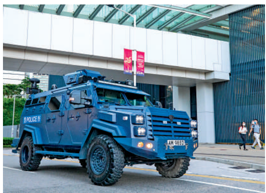
▲「劍齒虎」裝甲車在政府總部一帶巡邏。

今日凌晨起灣仔北將分階段封路，特別交通安排期間，會展站公共運輸交匯處及博覽道東巴士總站亦將臨時停用，途經巴士將改道或縮短路