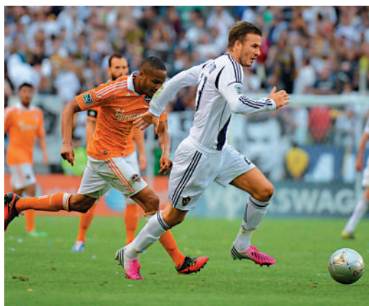
▲碧咸（右）當年轉投洛杉磯銀河，令美職關注度大幅提升。資料圖片

還有不少歐洲國家的傳奇球星曾在美職比賽，例如法國射手亨利，效力紐約紅牛4年間雖未獲任何主要錦標，但每仗都視作歐聯決賽般比賽。瑞典「無冕球王」伊巴謙莫域效力銀河兩季合共取得超過半百入球，其精湛射術也令其他球員獲益不淺。西班牙射手韋拿、德國中場舒拿思史迪加、法國中場馬度迪等，更是曾經贏過世界盃的冠軍人馬。