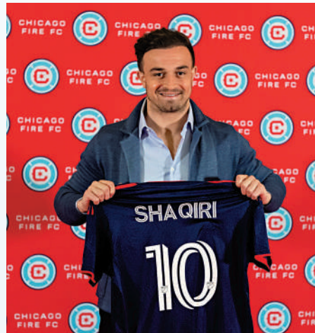
▲瑞士國腳沙基利較早前加盟芝加哥火焰。