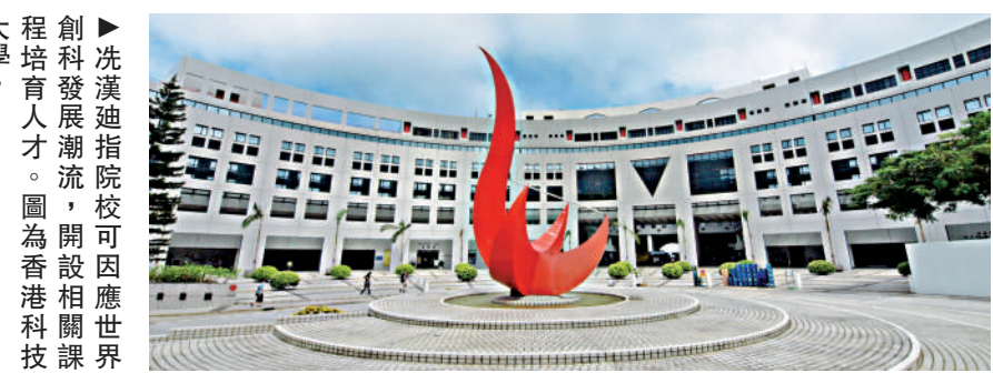
創科發展潮流，開設相關課程培育人才。圖為香港科技大學。

特區政府亦可參考深圳或內地其他地區的人才引進計劃，提升海內外人才在港扎根的吸引力，並透過善用閒置的政府物業或提供租金資助等，降低創業成本。