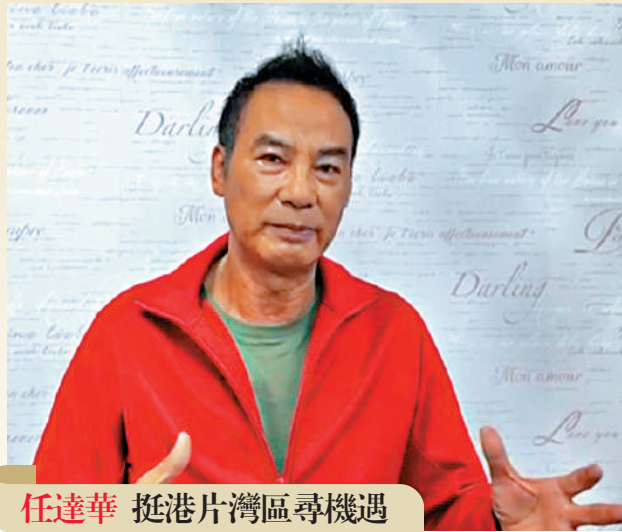
任達華 挺港片灣區尋機遇

「香港回歸祖國25周年，回歸後像有了一個家，給我安心的感覺。以前香港拍很多警匪片，是動感之都。大灣區這麼大，我們可以發掘更多年輕演員、導演，在電影中加入更多生活的元素，如農民、特色街道，人物上亦可以有更多變化，為電影注入新生命。我期望香港愈來愈好，香港特區政府換上新班子，希望新班子敢於創新。」