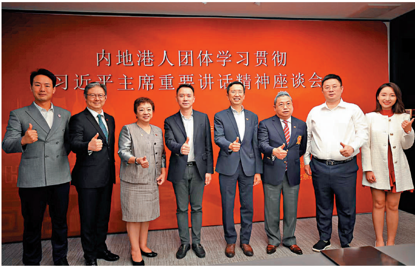
▲7月2日，內地港人團體在北京舉行座談會，學習貫徹習近平主席重要講話精神。

習主席在慶祝香港回歸祖國25周年大會暨香港特別行政區第六屆政府就職典禮上深刻指出，當前，香港正處在從由亂到治走向由治及興的新階段，未來5年是香港開創新局面、實現新飛躍的關鍵期。他對新一屆特區政府團結帶領社會各界實現良政善治、建設美好香港提出4點希望：着力提高治理水平、不斷增強發展動能、切實排解民生憂難、共同維護和諧穩定。他還指出，要特別關心關愛青年人。