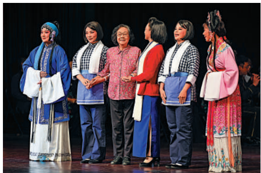
▲2021年，姚璇秋傳承潮劇精品欣賞會在廣州舉行。圖為姚璇秋（左三）與潮劇演員齊唱戲曲《春風放歌》。資料圖片

事實上，去世前姚璇秋還在為潮劇的發展奔走。2021年10月，姚璇秋來到中國戲曲學院，親自為就讀潮劇專業的本科生授課；2022年3月31日至4月30日，汕頭大學聯合廣東潮劇院舉辦「中國非物質文化遺產傳承人研修培訓計劃：首屆國際潮劇文化研修班」，姚璇秋擔任班主任，當時除線下25名學員外，還有來自港澳地區和新加坡、馬來西亞、泰國等地的22名學員在線上旁聽；2022年6月9日，姚璇秋作為特邀代表參加了廣東省劇協第十一次會員代表大會，為廣東全省戲劇發展建言獻策；2022年6月26日，姚璇秋還赴海南為汕頭成功申辦2024國際潮團年會站台助力。