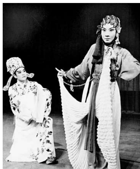
▲《梅亭雪》劇照，右為姚璇秋。

在潮劇界，姚璇秋是名副其實的潮劇符號、當代潮劇表演界的扛鼎人物。姚璇秋唱功深厚、風格鮮明，繼承了潮劇青衣旦行的傳統表演藝術程式，又廣泛學習融化兄弟劇種的表演藝術，在實踐中逐步形成自己的表演風格，對潮劇演唱藝術有深刻的影響。她主演的《掃窗會》《蘇六娘》《荔鏡記》《續荔鏡記》《江姐》《春草鬧堂》等劇目都成為潮劇經典。