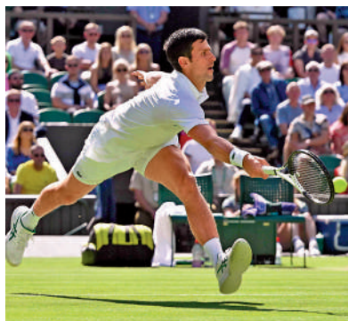
衛冕冠軍的祖高域與25號種子基士文洛域對陣，前者首盤便贏6：0，祖高域在溫網賽場先贏首盤的比賽均能取勝，今仗也一樣，之後再贏6：3、6：4晉級，錄得個人大滿貫單打的第330勝。

【大公報訊】溫布頓網球公開賽昨天舉行男女單第3圈賽事，男單頭號種子、塞爾維亞名將祖高域（圖）以盤數3：0勝同胞基士文洛域，賽後錄得溫網24連勝殺入16強；中國「一姐」張帥迎戰法國的卡露蓮加西亞，最終張帥在雙「搶七」下還是以0：2落敗，無緣女單16強。（NOW670、671及612台今晚6時直播16強賽）