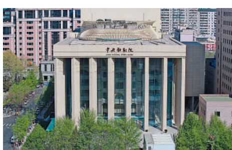
▲中央歌劇院劇場外景。