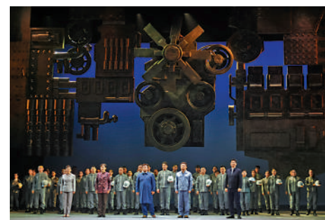
▲今年6月，原創歌劇《道路》演出拉開「慶祝中央歌劇院成立70周年」序幕。

其中，取材於柯爾克孜族的同名民族英雄史詩《瑪納斯》不僅在上海合作組織青島峰會期間上演，還受邀到吉爾吉斯國家芭蕾舞歌劇院演出，成為「一帶一路」民心相通的體現。