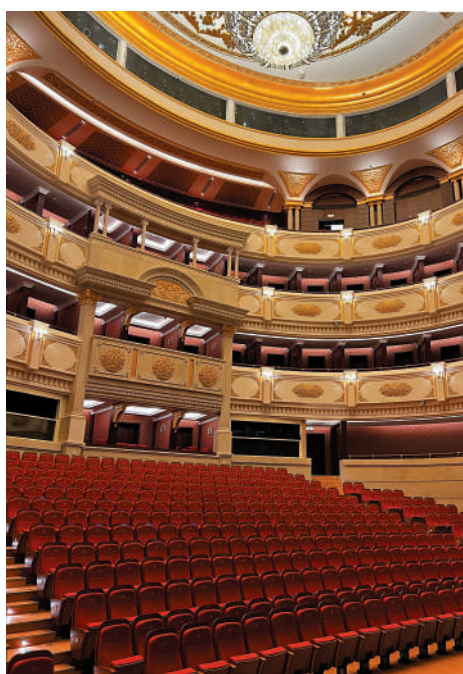
▲對於歌劇院來說，良好的聲音效果對演出成功至關重要。