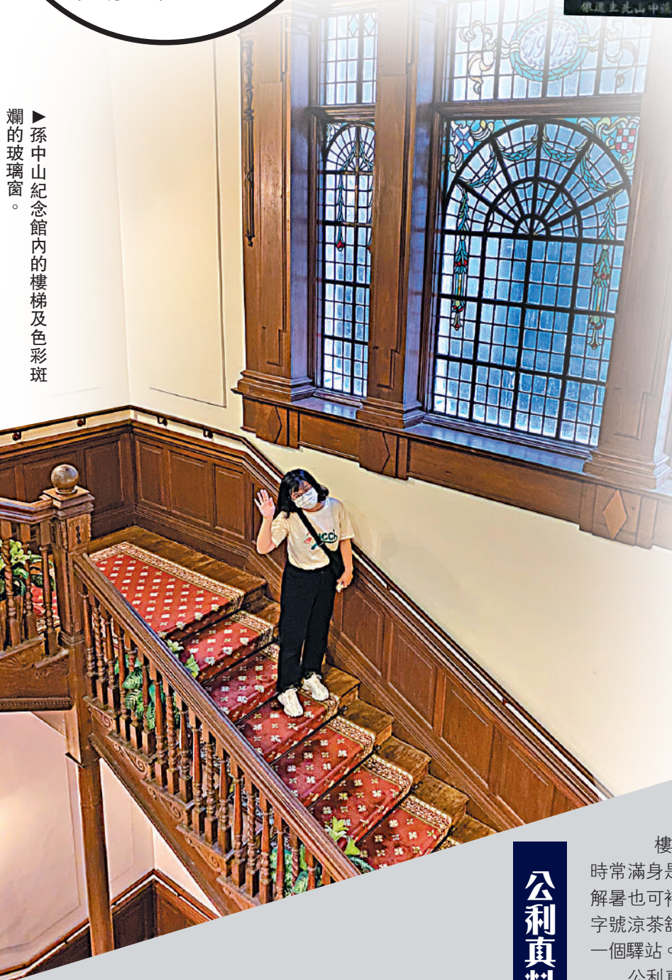
►孫中山紀念館內的樓梯及色彩斑斕的玻璃窗。

除了孫中山紀念館這一份，這棟百年古典建築還是香港歷史博物館的分館，在2010年被列為法定古蹟，在此參觀如同進行一場時空穿梭，還能一路了解孫中山的事跡和館內藏品的故事，享受一場視覺和知識的盛宴。