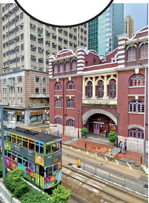
◀西港城現時為全港最古老的街市建築物。

地址： 上環德輔道中323號 如何前往： 港鐵上環站B出口。或乘搭巴士路線1/5B/26/71/113等，於「西港城」站下車。