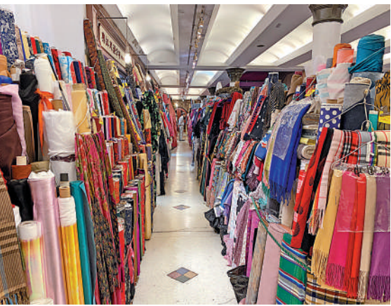
▼西港城第二層有10多間從中環花布街遷入的布行。