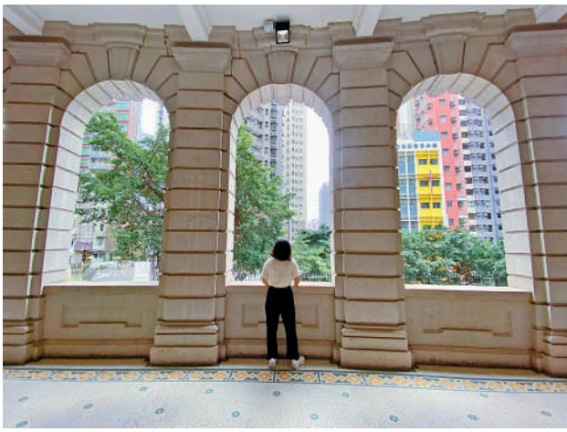
►弧形陽台有希臘式巨柱承托，糅合巴洛克風格。