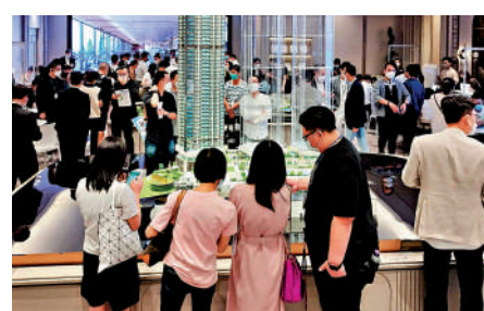
▲日出康城凱柏峰I 落實本周四次輪開售238伙。

已兩度加推單位，發展商昨晚上載銷售安排，落實本周四次輪開售238伙。 此外，受到上周六懸掛八號風球影響，長實（01113）及新地（00016）合作的屯門青山公路飛揚，順延至昨日進行次輪銷售，以價單發售72伙及招標出售8伙，消息指全日沽出約11伙。 佳寧娜地產與宏達控股合作的深水埗海壇街新盤佳悅，上周三公布首張50伙價單，消息指，項目過去4日累計收票約100張，超額認購約1倍，有一組西九龍家庭客入6票，有意認購3伙開放式單位。綜合市場資訊，過去3日一手成交約19宗，周六日佔約14宗，料為3月中旬以來最淡靜的周末。