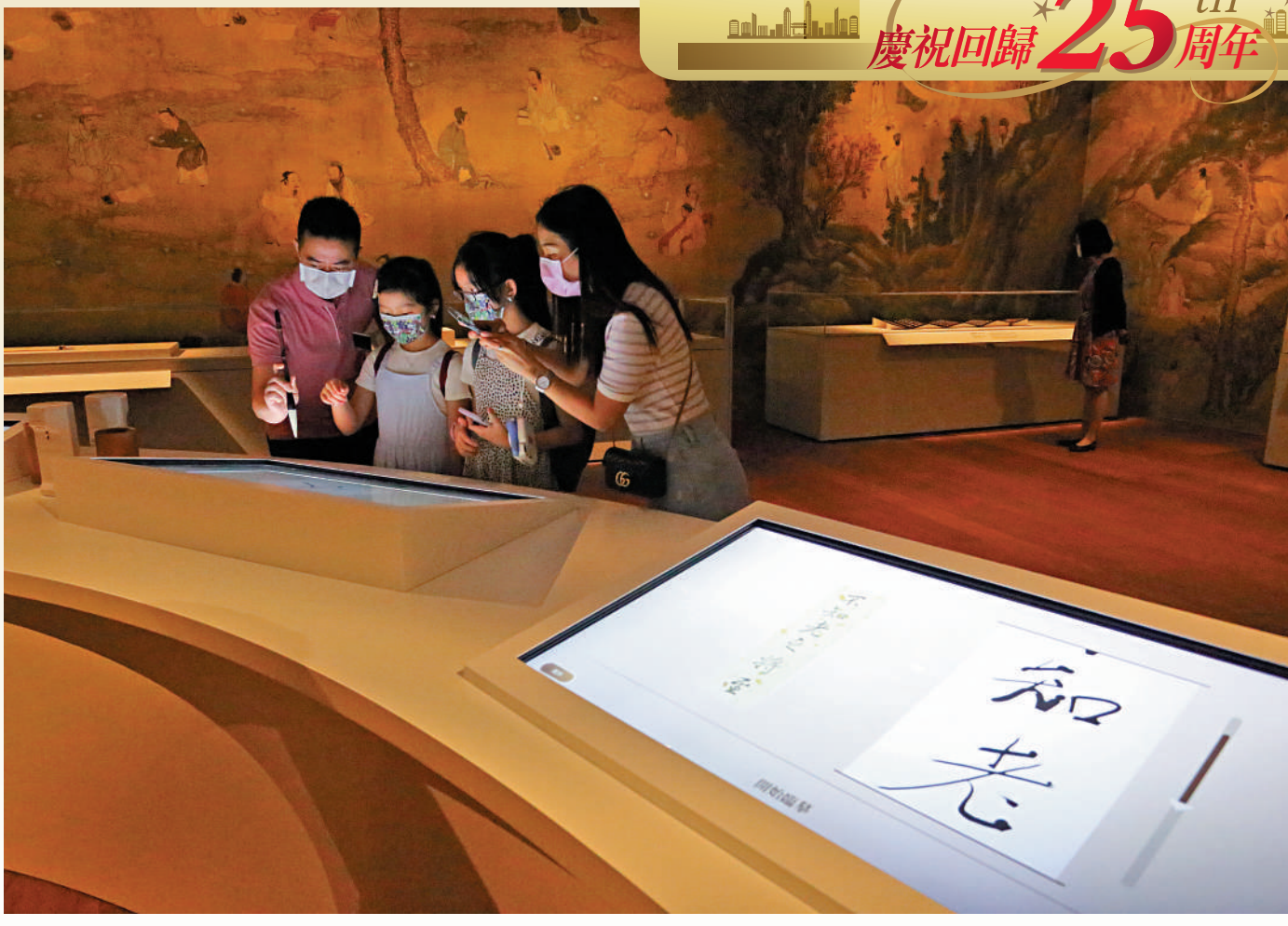
展廳2設有書法臨摹裝置，不少參觀市民都上一展身手，揣摩乾隆摹寫《蘭亭序》的神韻與技法。