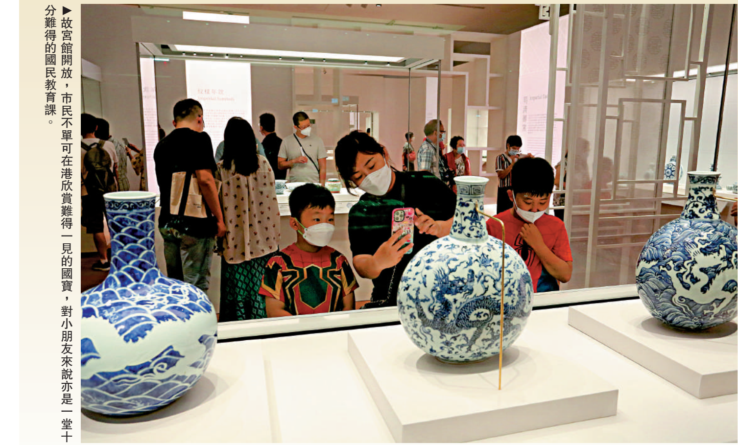
故宮館開放，市民不單可在港欣賞難得一見的國寶，對小朋友來說亦是一堂十分難得的國民教育課。

香港故宮文化博物館正式向公眾開放，文化體育及旅遊局局長楊潤雄與嘉賓出席香港故宮文化博物館開放儀式。