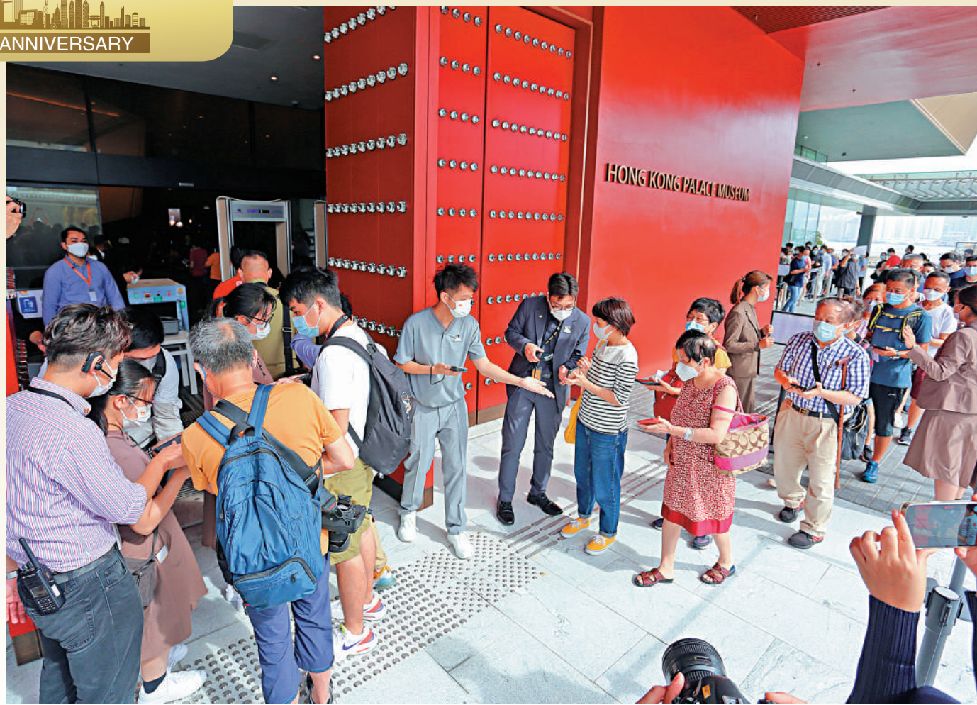
香港故宮文化博物館昨日正式向公眾開放，大批市民一早到場等候，館方提早於九時開放入場。

全城翹首以待的香港故宮文化博物館昨天開放，反應熱烈，全日接待近六千五百人入場。排頭位的觀眾早上七時多已到場，直言心情興奮，大讚館內展品「好正！」不少對中國歷史愛好者「細隊」前來。有觀眾認為，香港故宮館是讓大家更好認識中國歷史的開始，已購票準備再入場。有來自外國觀眾表示，展覽印象深刻，好好價值。館內的多處裝置、展品成為入場觀眾的熱門打卡位，書法臨摹、「清宮照相館」等互動裝置，吸引各年齡層市民嘗試。