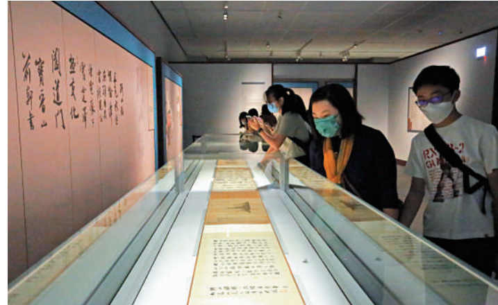
8號及9號兩個特別展廳中，匯集35件遠至唐宋時期的書畫經典名作，惟因保存問題，展期只有一個月，包括北宋米芾行書《研山銘》卷。

文化體育及旅遊局局長楊潤雄昨日出席香港故宮館開放參觀儀式後會見傳媒時表示，香港故宮館是香港發展為中外文化藝術交流中心的重要