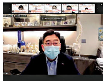
▲高永文透過zoom連線作主題演講。

林哲玄作總結發言時表示，籌辦研討會僅短短數日，卻得到超過30個醫療衛生專業團體的支持，證明意志決定效率。面對無限機遇，醫療衛生專業更應務實有為，以今日作為一個新起點，加強合作，共同發展。