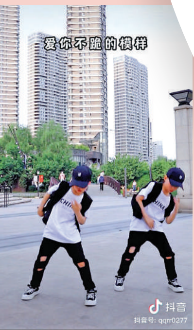
▲有家長和老師為《孤勇者》編排了專業舞步，教孩子表演。