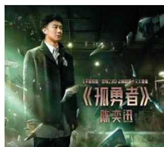
▲陳奕迅演唱的《孤勇者》意外在小學生中走紅。