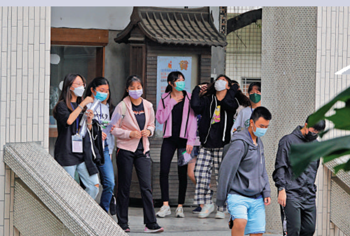
▲由於出生率低，島內學生人數逐年減少。不少私校招不到足夠的生源。