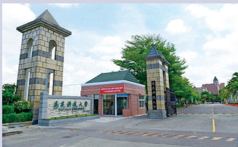
▲高雄市私校高苑科技大學近年爆出財務危機，成為私校退場過程中受關注的學校。

【大公報訊】有逾50年歷史的台灣私立學校蘭陽技術學院日前申請停辦。自2014年以來，全台已有至少6所私立學校「退場」。「少子化」對辦學帶來的衝擊，引起台灣社會越來越多關注。據台當局有關部門統計，全台5月新生兒5.5萬人，創歷年單月最低，「少子化」持續嚴峻。此外，為尋找生源，部分私校出現不少亂象，聲譽受損。