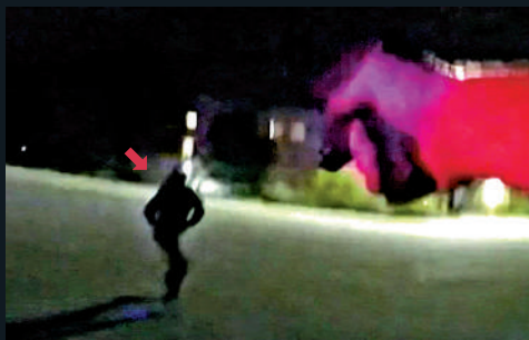
▲警察舉槍向沃克射擊。