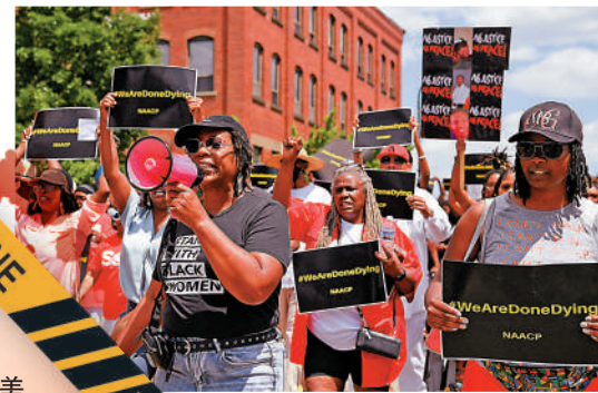
▲阿克倫市3日舉行抗議警察槍殺非裔的示威。

拜登將於當地時間4日下午在白宮發表任內第二個獨立日講話。美媒表示，與去年獨立日拜登宣布「美國即將走出新冠疫情」時的意氣風發相比，今年他的處境急轉直下，面對社會撕裂、疫情反彈、通脹高企等多重危機。美聯社和芝加哥大學全國民意研究中心合作進行的最新民調顯示，拜登的支持率維持在39%的低位。