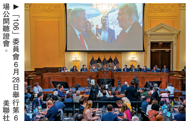
▲「106委員會」6月28日舉行第6場公開聽證會。

7月，「106委員會」將舉行至少兩場聽證會。委員會成員金辛格表示，哈欽森現場作證激勵了更多人站出來發聲。委員會已向白宮律師希波隆發出傳票，他有望於6日向調查人員提供證詞。