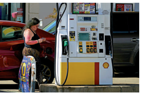
▲美國油價居高不下，圖為美國民眾6月30日在加油站加油。

拜登2日在推特向運營加油站及制定油價的公司喊話：「現在是戰爭和全球陷入危機的時刻，降低你們在加油站的收費標準，以反映你們為產品支付的成本。現