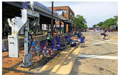
▲美國海蘭帕克市一處國慶巡遊突發槍擊案，民眾逃亡後現場混亂。

亞利桑那州首府鳳凰城取消了3場獨立日煙花秀，原因是無法購買到足夠的煙花。堪薩斯州渥太華市政府2月訂購的煙花迄今未送到，只能將獨立日煙花表演推遲到兩個月後的勞動節。美國全國煙花協會發言人法恩斯沃思表示，由於疫情下全球供應鏈中斷，進口煙花無法正常進入美國港口；受油價上漲影響，運輸煙花的成本也大幅增加。他舉例說，該協會一家會員公司2019年運送一個集裝箱的費用是9800美元，但今年已飆升至3.6萬美元。