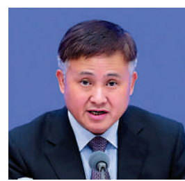
▲潘功勝稱，債券通境外投資者持債總規模3.7萬億元人民幣。