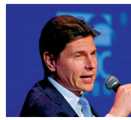
▲歐冠昇表示，將持續拓展和豐富債券互聯互通市場品種。