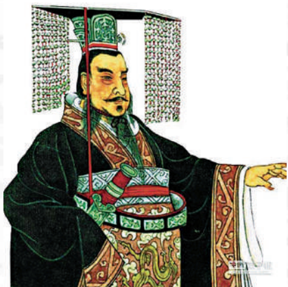
新字。▲相傳秦始皇與武則天都創造了不少新字。