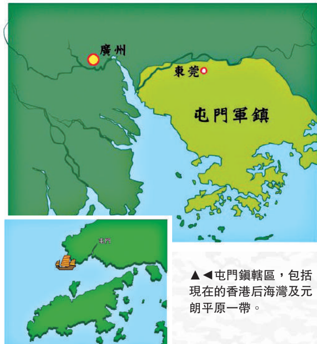
▲屯門鎮轄區，包括現在的香港后海灣及元朗平原一帶。

門軍鎮，以同知屯門鎮檢點率兵駐守，惜駐兵數目未詳。元大德陳大震《南海縣志》卷十〈兵防〉〈巡檢寨兵〉條載，元代改設屯門巡檢，額管寨兵150人。