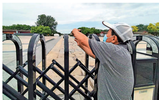
▲一位路過盧溝橋的行人隔着圍欄拍攝盧溝橋。

溝橋，「當時孩子還有點小，同行的人也多，所以想着帶她再來看一看，正好7日是『盧溝橋事變』85周年，還挺有意義的。」這位家長說，跟孩子一邊看一邊用手機搜索了很多相關知識，「當日日軍盯上了盧溝橋旁邊的那座龍王廟，目的其實是要控制盧溝橋北面300米的盧溝大鐵橋，這座大鐵橋才是入京交通要道。一路參觀自己也對盧溝橋有了更多新認知，很遺憾抗戰紀念館暫時不能進去，以後有機會再帶孩子來看展覽。」