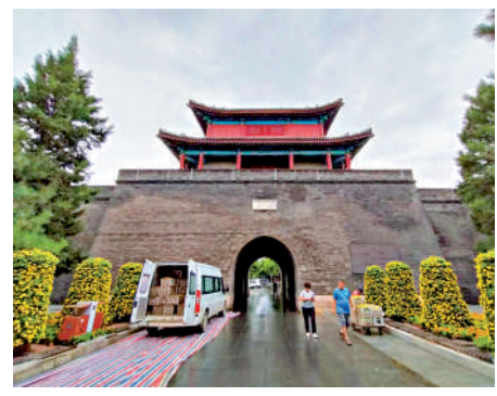
▲宛平城內在布置花壇。

站在永定河畔憶古思今，如張大爺所說，「要居安思危，做好本分，大家一起使勁，國富民強才能保證不被侵略欺負。」