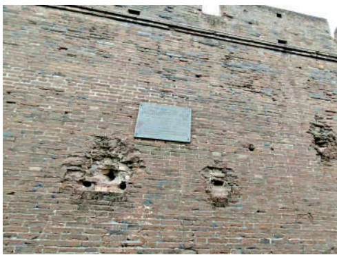
▲宛平城外城牆上日軍侵略者留下的炮彈坑。