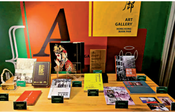
「歷史文化·推薦作家」區展示書籍。