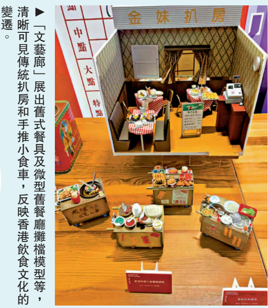
「文藝廊」展出舊式餐具及微型餐館擺檯模型等，清晰可見傳統扒房和手推小食車，反映香港飲食文化的變遷。

第32屆香港書展將於7月20日至26日在會議展覽中心舉行。作為慶祝香港回歸25周年活動之一，今屆書展年度主題是「歷史文化，城市書寫」，並以「從香港閱讀世界：憶·寫香港故事」點題，以城市發展軌跡為主軸，穿梭不同作家及其個人情懷，展現香港魅力。