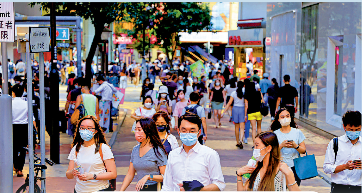
▲本港新冠疫情有反彈跡象，昨日新增確診中，本地感染有2672宗。

梁子超又提醒，涉及變種病毒個案，雖然短期內未必會急劇上升，但一至兩個月後，有機會逐漸滲入學校、大廈等人群密集場所，並加速傳