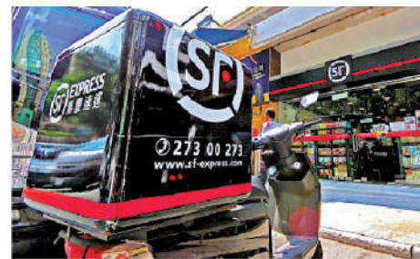
▲順豐香港表示，香港及澳門寄往內地所有快件類別的收寄服務恢復正常。