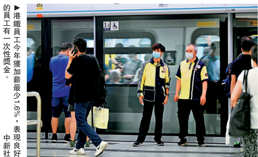
港鐵員工今年獲加薪最少1.6%，表現良好的員工有一次性獎金。中新社