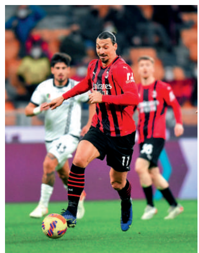
◀伊巴謙莫域與AC米蘭續約。

另一方面，上季約滿曼聯、現屬自由身的法國中場保羅普巴，據報將於本周末接受祖雲達斯體測，順利的話亦將正式重投該隊。普巴在2016年以破當時世界紀錄轉會費的8900萬鎊，由祖雲回巢曼聯；預計普巴將於下周開操，稍後隨隊出發到美國作季前集訓。