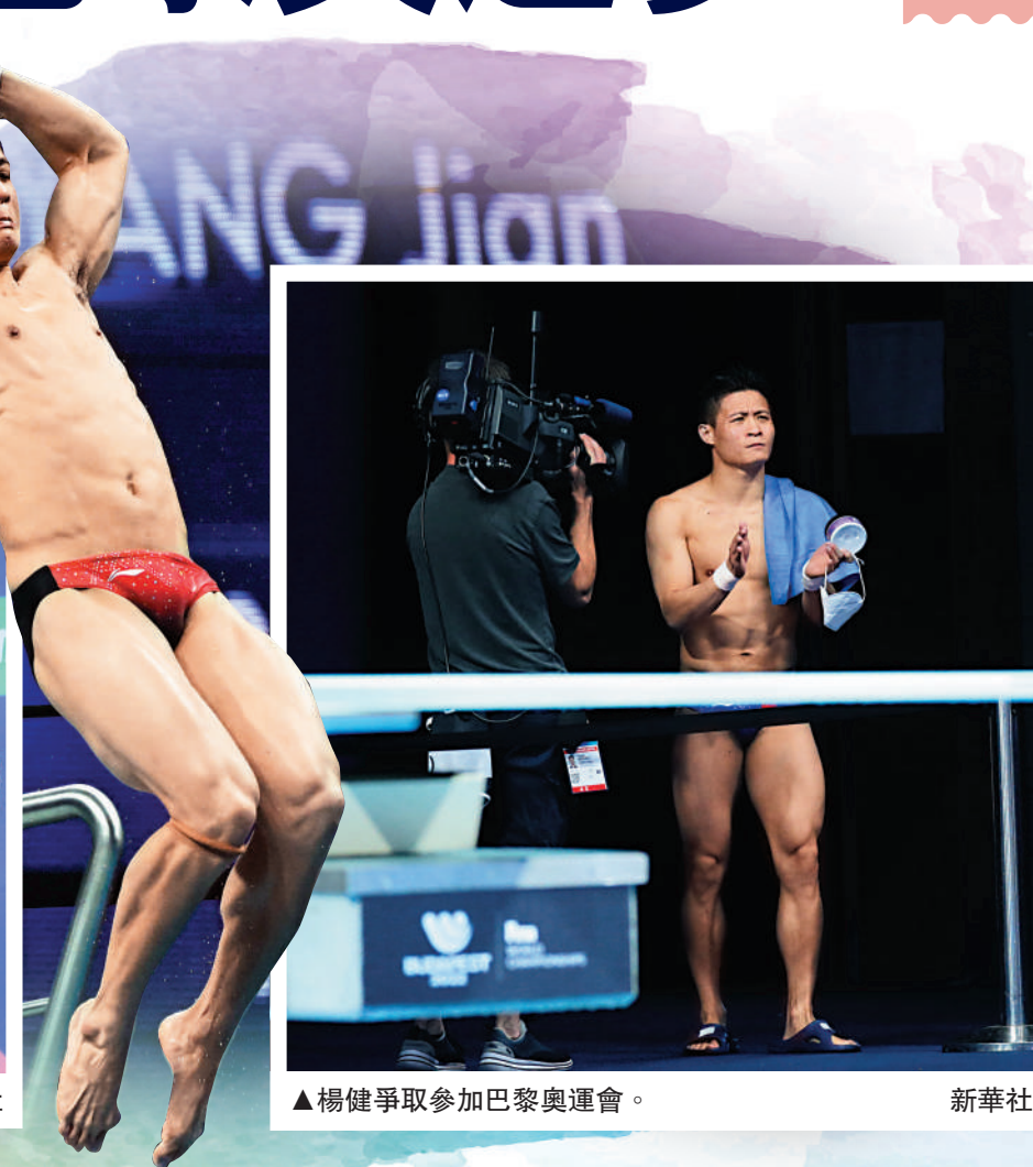
▲楊健爭取參加巴黎奧運會。

在跳水「難度王」楊健看來，對動作精度的把控正是跳水運動的魅力所在，沒有一個運動員可以百分之百重複自己上一跳的動作，但所有運動員都希望自己的動作精益求精，「總有一個目標促使我們前進」。「我們每天練習這些動作，每個動作跳上萬次，最後在賽場上給大家展示就是那6個動作。」楊健說。