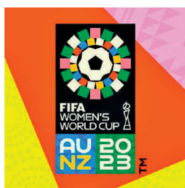
◀女足世界盃賽事徽章。

將有10支球隊參加女足世外圍賽附加賽。泰國隊和中國台北隊已經確認進入附加賽，其餘八支球隊將通過各洲際賽事獲得附加賽資格。