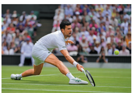
▲祖高域驚險反勝晉級溫網男單四強。