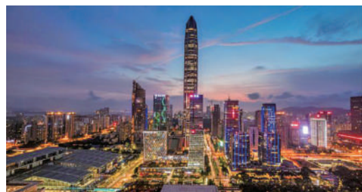
▲福田是深圳傳統金融強區。

今年是香港回歸祖國25周年，從1997年到2022年，深圳與香港兩座一衣帶水的城市，在歲月的洗禮中，攜手同行，共創輝煌。尤其是《粵港澳大灣區發展規劃綱要》發布以後，面對「一個國家、兩種制度、三個關稅區、三種貨幣」的機遇與挑戰，深港攜手，以金融助力灣區發展更是勢在必行。