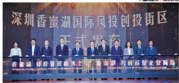
▲深圳香蜜湖國際風投創投街區發布儀式。