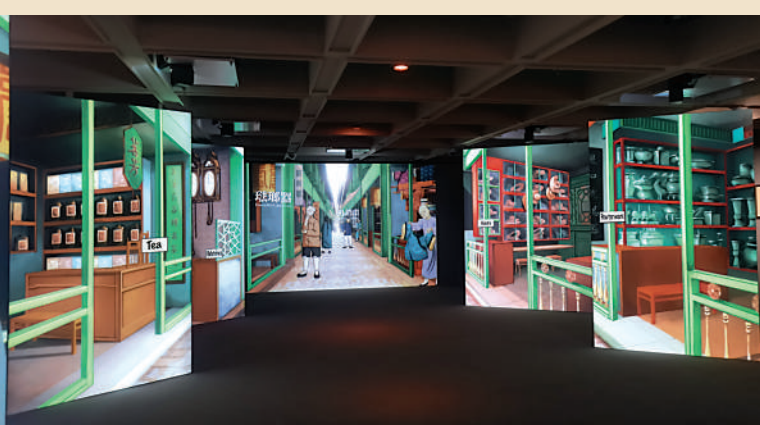
▲「廣州購物誌——18至19世紀外銷藝術」展覽廳一隅。