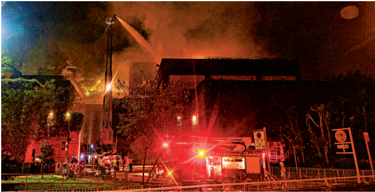
►飛鵝山安達臣道豪宅昨日凌晨發生三級火警，現場濃煙滾滾，消防架起雲梯撲火。