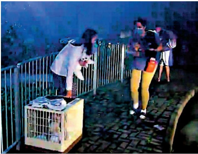
▲豪宅內工作人員帶同多隻寵物犬疏散至屋外。