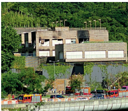
▲起火豪宅位於安達臣道9及11號，佔地五萬多平方呎。