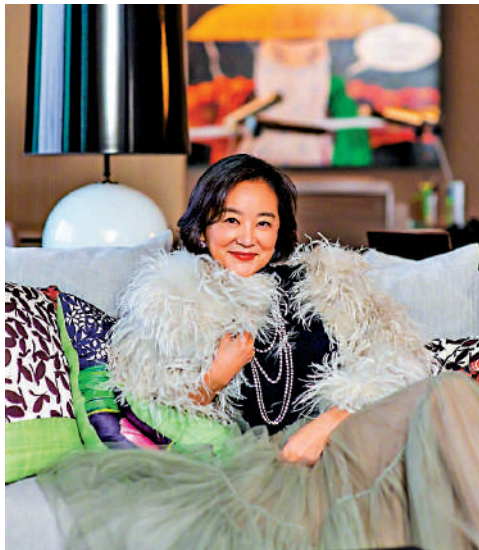
▲消息指出，起火的兩層高獨立屋屬於著名女星林青霞所有。火警發生時，她不在屋內。