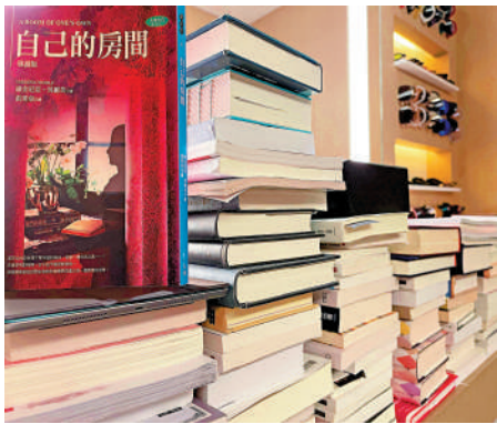
▲疫情期間林青霞曾公開自己的化妝枱照片，上面放滿書本。