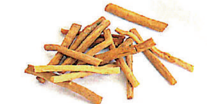
▲牛膝可補肝腎，強筋骨。