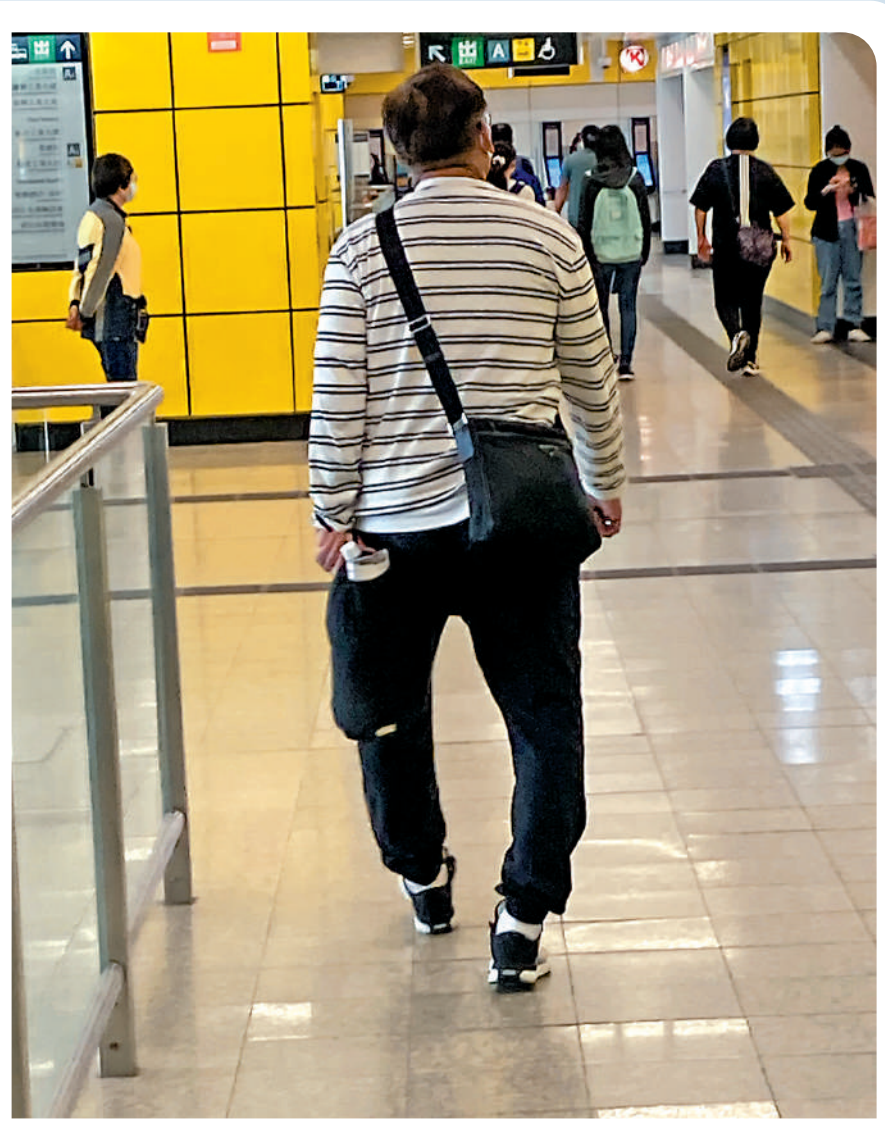
▲長期姿態不良可致雙腿骨骼變形。