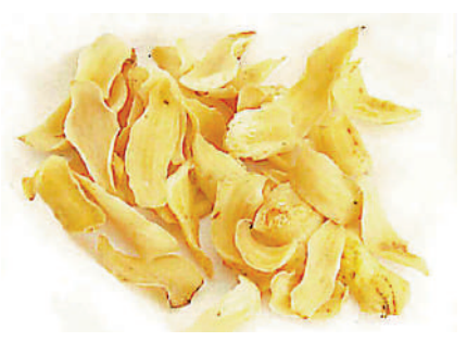
▲百合是多年生草本植物。

另外，百合潤肺止咳，清心安神，但藥力平和，難圖速效，所以多作為食療佳品。以百合作食療，有如下選擇：百合粥、百合雞子黃湯、蜂蜜蒸百合等，如能常服，則補脾肺，安精神，除煩熱。