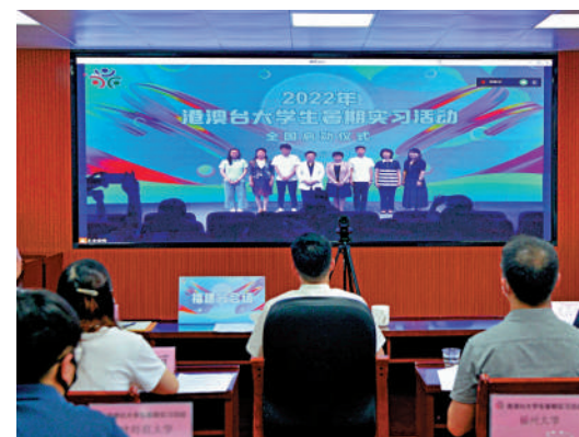
▲港澳台學生在福州通過視頻觀看2022年港澳台大學生暑期實習活動全國啟動儀式。中新社

記者了解到，福建省將實習地點設在福州和廈門兩地，廈門大學、華僑大學、福州大學、福建師範大學、集美大學五所試點高校的港澳台在讀本科生、研究生參加。經過徵集崗位、學生報名、篩選錄用等環節，參與實習活動的港澳台大學生32名。學生們將開展為期4周實習和1周研學、參訪、交流活動。實習單位涵蓋傳媒、心理、金融財會、信息技術、建築工程等七大類行業。