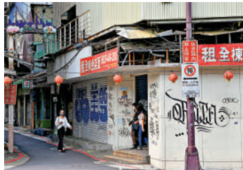
▲台灣民間消費低迷，台北市西門町商圈很多店舖關張待租。

南京大學台研所青年學者溫天鵬向大公報表示，受新冠肺炎疫情以及全球通脹壓力影響，台灣社會分配不公與貧富差距加大的矛盾越來越突出，導致年輕世代對未來失去信心與希望。他認為，台灣青年應大膽西進，到大陸尋找更好的發展舞台，這樣才能走出「貧者更貧」惡性循環。