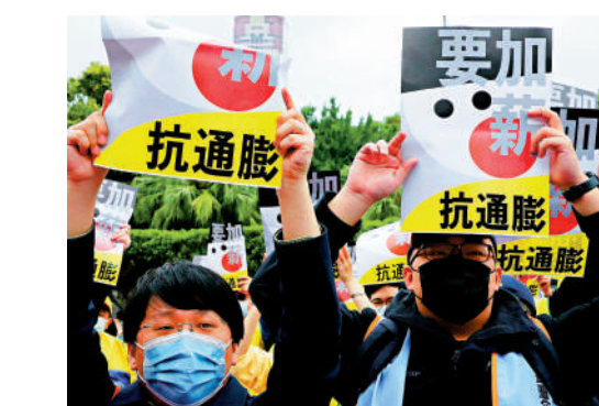
▲5月1日，台灣多個勞工團體在台北凱達格蘭大道集結，高舉標語表達訴求。