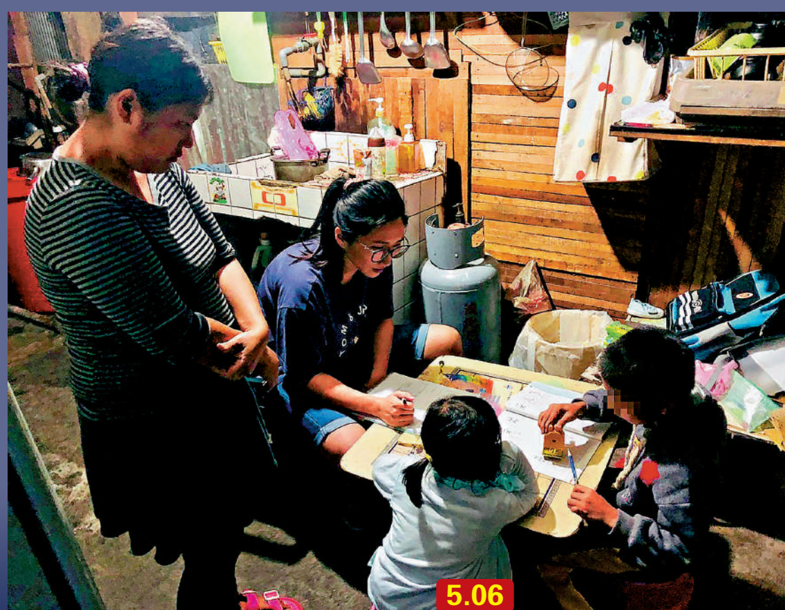
▲受疫情衝擊，台灣地區民眾所得高低差距擴大到149倍。圖為6月1日，台灣兒童暨家庭扶助基金會社工走訪貧困家庭。