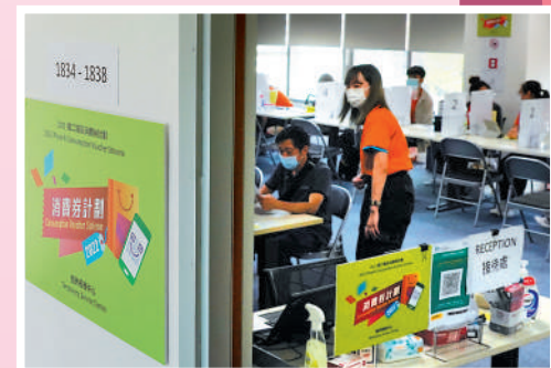
▲新一輪電子消費券已接受申請轉換領取平台，政府開放旺角的臨時服務中心協助市民登記。