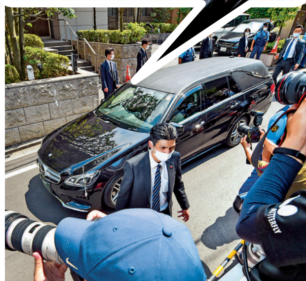
▲在安倍昭惠的陪伴下，載有安倍遺體的靈車9日抵達安倍位於東京的家中。