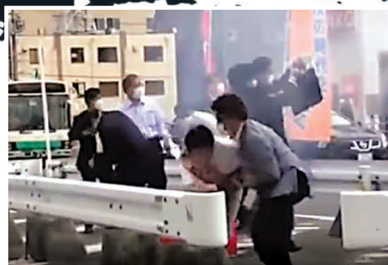
◀第二聲槍響後，安倍中槍倒地。視頻截圖