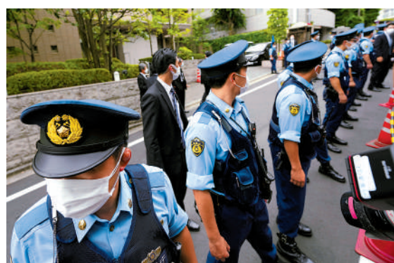
◀大批警員9日在安倍東京的住宅前戒備。

俄烏衝突爆發後，德國等國已表示將把軍費與GDP之比提高到2%以上。日方表示，俄羅斯近來在日本附近的軍事活動增多，朝鮮今年多次試射導彈，加劇東亞地區的緊張局勢。