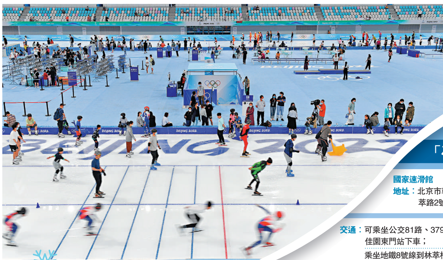
◀7月9日，國家速滑館對公眾開放首日，遊客在場內體驗滑冰。新華社

作為北京冬奧會標誌性場館，國家速滑館「冰絲帶」9日正式面向社會開放，提供豐富的遊覽服務，包括冬奧標誌性景觀和賽時紀錄牆打卡，開放總冰面積的一半約3000平方米冰面，供公眾深度體驗冬奧文化。大公報記者來到朝陽區奧林匹克公園，實地探訪在北京冬奧會閉幕後「不一樣的冰絲帶」。現場景觀布置保留了冬奧會時期的全部奧運元素，大批期待已久的首都市民迫不及待地近距離欣賞中國的冰上建築美學，親身走上冰場，體驗高科技競技場中「最快的冰」。