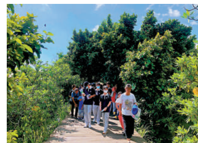
▲青少年學生參加自然教育活動體驗。

展品和進行多種趣味互動體驗的同時，收穫更多自然知識。此外，還首次開啟「綠水青山自然教育行」全媒體宣傳活動。