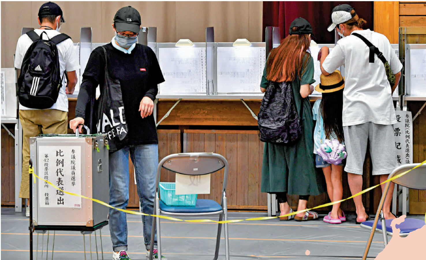
▲日本選民10日在東京參加參議院選舉投票。