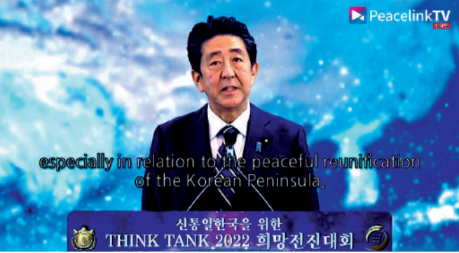
▲安倍據報曾於2021年出席統一教的線上活動。

統一教9日發表聲明，對安倍遇害表示「震驚和悲痛」，並強調「槍支在我們的信仰和實踐中沒有立足之地」。值得注意的是，文鮮明之子文亨進在與母親韓鶴子爭權失敗後，在美國自立門戶創建了一個分支教會，大肆鼓吹槍支暴力，甚至要求教徒攜帶步槍參加集體婚禮。