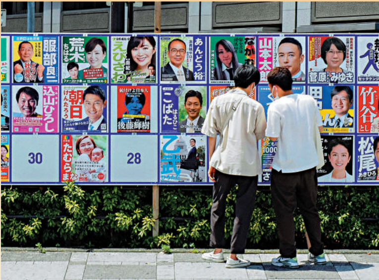
▲日本年輕群體投票意願不高，圖為日本民眾10日看競選海報。