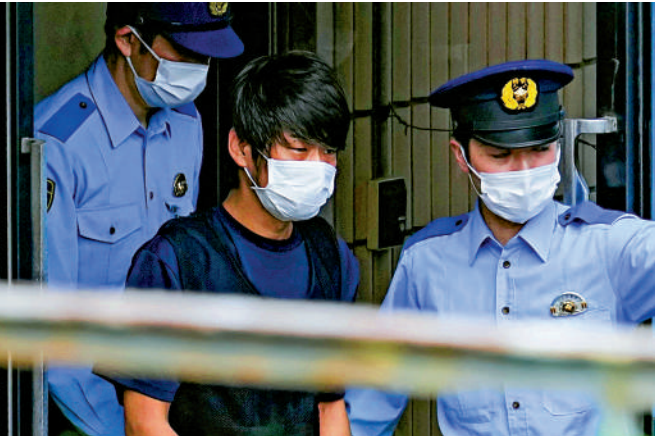
▲刺殺安倍的嫌犯山上徹也10日被移交檢察院。

自民黨奈良縣支部聯合會透露，案發時有來自警視廳和奈良縣警方的7名特警，以及來自聯合會的15名工作人員負責保護安倍，但仍未能阻止嫌犯近距離開槍。現場視頻顯示，安倍中槍倒地後，遠處一名安保人員並未優先衝向安倍或嫌犯，反而停下腳步攙扶被其撞倒的女學生。有網友批評該名安保人員不夠專業。