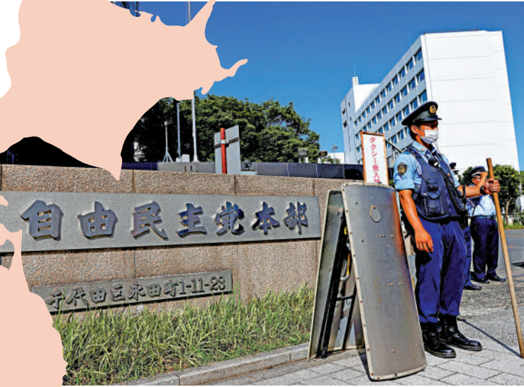
▲安倍晉三遇刺後，日本各黨派均加強安保，圖為警察10日在自民黨總部附近守衛。