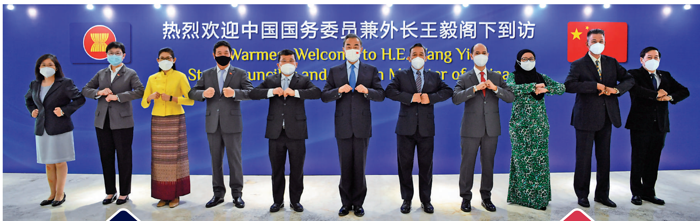
热烈欢迎中国国务委员兼外长王毅阁下到访