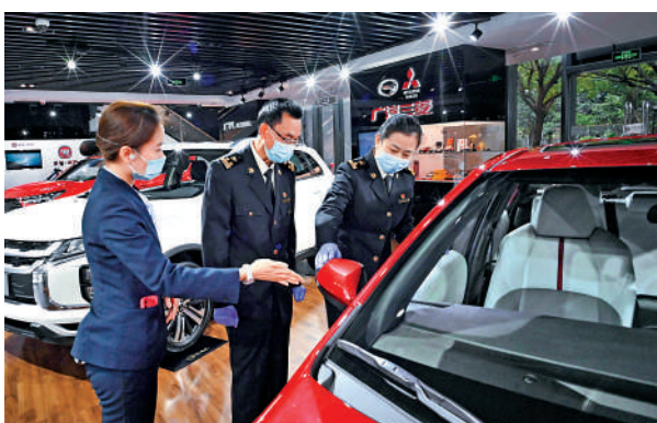
▲廣州海關關員前往廣汽商貿有限公司宣講，為企業定製RCEP「攻略」。資料圖片

地。從這個角度說，香港的專業服務業，香港的供應鍊、物流鍊，肯定要鏈接這塊區域，為整個這塊區域提供高質量的服務，所以如果香港能有效地融入到這個區域一體化，融入到RCEP的話，