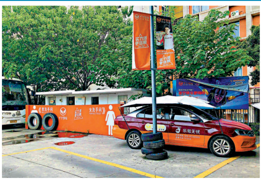
▲YY學車暨大訓練場車輛印有子公司樂駕無憂字樣。