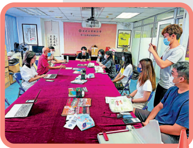
▲工聯會廣州服務中心接受港生求助。

關係，且在7月9日已停止合作。「我們從今年2月開始就沒有收到YY學車支付的場地租金和教練工資，現在學車的都是其他渠道報名的學員，我們也是受害者。」該工作人員還表示，廣州市交通委員會及當地派出所已於當天到訓練場了解情況，並承諾近期會給出答覆。目前該訓練場有登記在冊尚未完成駕照的YY學車學員600多人。