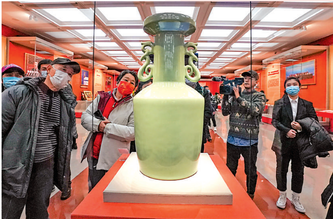
▲除了受贈禮物，中央禮品文物管理中心還展示了不少對外贈禮，如2016年二十國集團領導人杭州峰會上，中國對外贈送的青瓷20雙耳瓶。