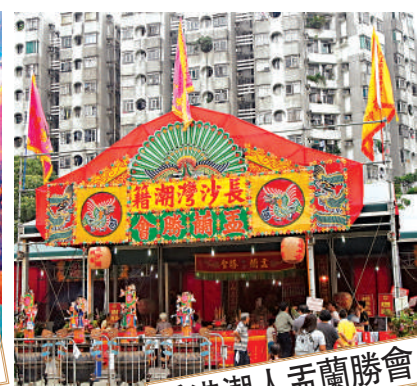
香港潮人盂蘭勝會