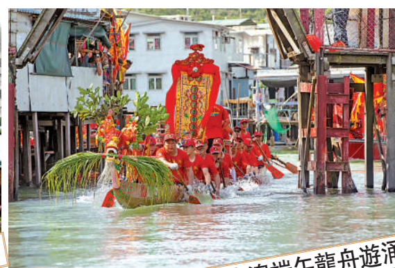
大澳端午龍舟遊涌