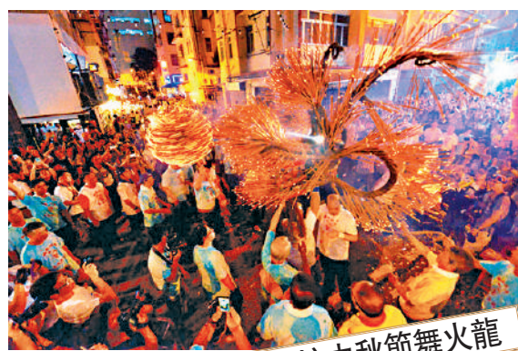
大坑中秋節舞火龍