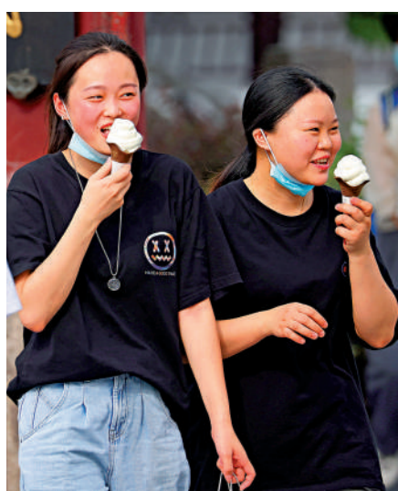
▲7月10日，江蘇南京，市民在高溫下的街頭經過。

過去一周浙江全省持續高溫，僅13日一天，全省就發布54條高溫紅色預警，打破日發布量最高紀錄。浙江多家醫院屢有收治熱射病患者。