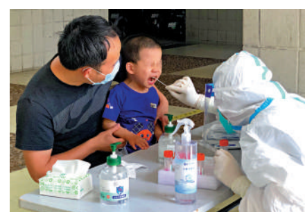
▲廣東珠海新一輪疫情呈班級和家庭聚集性。圖為民眾做核酸檢測。

記者從發布會獲悉，新增27个病例均在已隔離管控的密接人群中發現，核酸檢測陽性後第一時間通過負壓救護車轉運至珠海市中大五院進行集中救治。目前，已對上述病例涉及