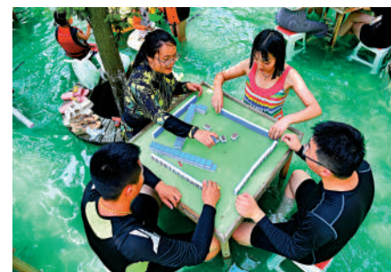
▲7月9日，在四川成都市民打「水上麻將」避暑。

做好各項消暑降溫工作，在家中備足清涼飲料，準備消暑降溫的藥物。」此外，他也提醒大家，如發生熱射病症狀，第一時間要安排及時送醫。在送至醫院途中或救護人員到達之前，應立即將患者轉移到通風陰涼處，脫去衣物散熱，或用濕毛巾冷敷頭部、腋下和腹股溝等部位加速散熱。同時採用側臥位，保持呼吸道暢通，防止發生窒息。