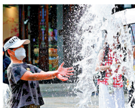
▲7月12日，江蘇南京，一名少年在街頭的噴泉處戲水覓清涼。

劉宏介紹：「在目前收治的熱射病病例中，年輕人大部分為勞力型熱射病，主要由於高溫天在戶外勞動、運動引發。而老年人或體弱人群大部分為非勞力的經典型熱射病，在我們收治的患者中，就有老年人為了節約用電不開空調，或者是嫌空調太涼，沒有做好防暑降溫通風措施，長時間在高溫高濕的環境中也容易中招。」因此，他建議，戶外工作者應注意避免長時間高溫作業，最好不要超過4個小時，要及時補水補液。長時間在室內的人群也要做好通風降溫等消暑工作。