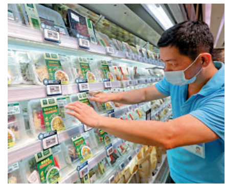
▲廣東某超市工作人員正將預製菜擺上貨架。

記者了解到，大灣區珠西物流建設一體化項目是建設大灣區珠西物流中心重要一環，通過建設物流保稅