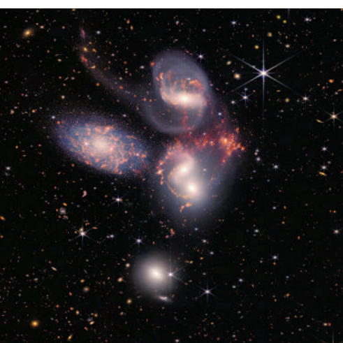
▲韋伯望遠鏡拍攝的斯蒂芬五重星系。