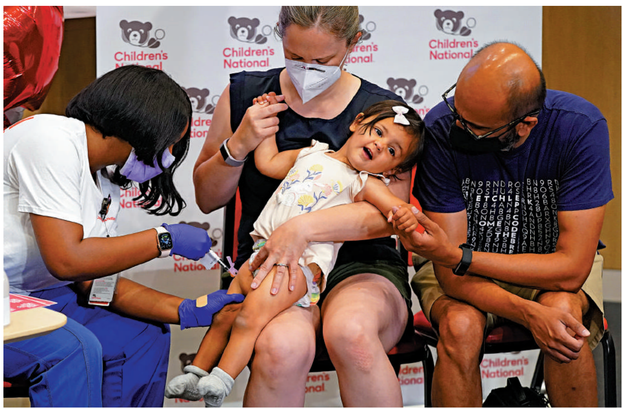
▲美防疫部門敦促民眾接種加強劑，圖為華盛頓14個月大幼兒接種首劑新冠疫苗。

倫敦帝國理工學院病毒學家皮考克表示，BA.2.75的突變像是將已有變種的突變結合在了一起，像是拿到「外卡」一般。這種特性讓BA.2.75可能成為傳播速度快、免疫逃逸能力強、致重症水平高的「集大成者」。