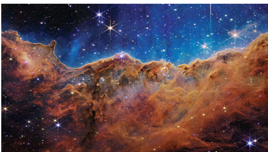
▲韋伯望遠鏡拍攝的船底座星雲。