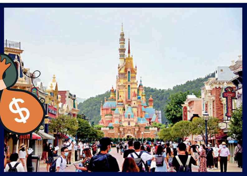
▲近日逾50名市民在迪士尼樂園facebook留言，指他們向一名自稱為樂園員工的人購買樂園產品而墮騙局。