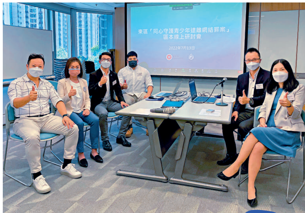
▲教育局港島東區學校發展組聯同東區警區合辦東區「同心守護青少年遠離網絡罪案」線上研討會，主要講解區內的青少年罪案趨勢、介紹不同的網上罪行手法及分享各種防騙知識。

教育局港島東區學校發展組聯同香港警務處東區警區合辦東區「同心守護青少年遠離網絡罪案」線上研討會，共有逾50間中小學的教師代表參與其中。