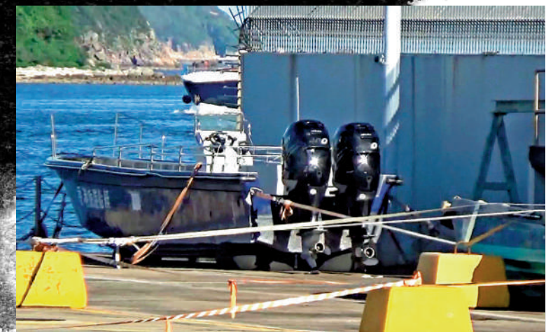
▲大公报記者昨日到西貢水警基地了解，發現一部被扣查疑涉案的快艇。

香港法學交流基金會副主席傅健慈指出，若被告在保釋期間有意圖潛逃，涉嫌違反法庭保釋條件，警方會盡快帶被告上庭，要求取消被告保釋，法庭聽取被告意見，若不接納並認為被告意圖潛逃證據充足，會即時取消擔保，還押被告直到下次上庭。傅健慈續指若控方加控被告違反法庭保釋條件，一般會待被告的原有控罪裁決後，法庭再一併處理。