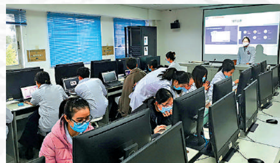
▲四川大學的口腔醫學在內地專業排名第一，該校率先採用口腔醫學影像檢查虛擬仿真實訓系統進行本科教學。

註：中、英、數、通四門課程總分達17分或以上，及必須選修化學或生物，並達到第2級。