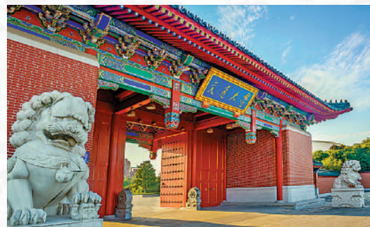
▲上海交通大學口腔醫學有近30所境外姐妹學校，每年選派學生前往美國、瑞典、日本等地進行交流學習。