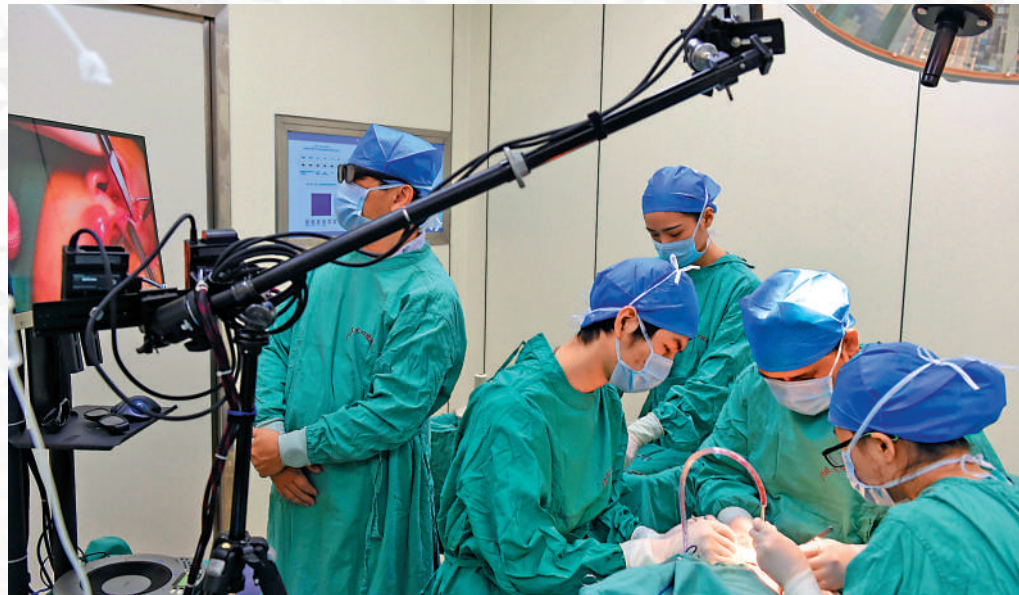
內地有不少大學開辦口腔醫學學位課程，有志成為牙醫的港生，可以因應自己成績報讀合適的院校。