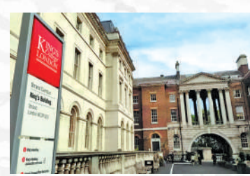
◀倫敦國王學院的牙科則排全球第九位，全球排名第1。

此外，所有申請人都必須在申請前參加英國醫科系的能力傾向試(UCAT)，且必須在申請同一年參加才能有效。