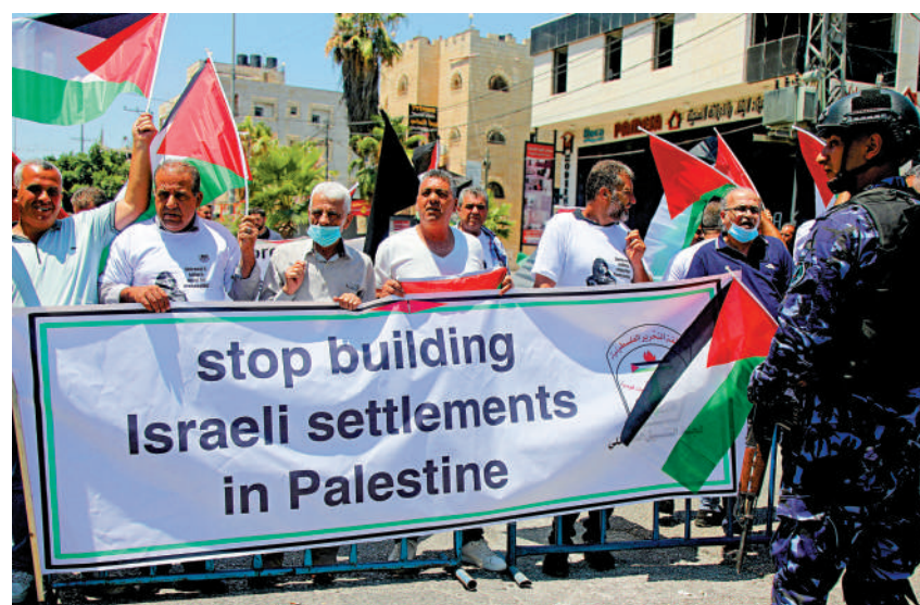
▲ 巴勒斯坦民眾15日舉行示威，要求以色列停止建立定居點。

特朗普極力促進以色列與阿拉伯國家關係正常化，而拜登亦未在這方面進行改變。拜登計劃15日從以色列直飛沙特阿拉伯，沙特同日宣布，向所有符合飛越沙特領空條件的航空公司開放領空，實際上解除了對往返以色列航班的限制。