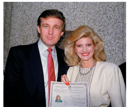
▲ 伊凡娜(右)1988年正式成為美國公民。資料圖片

上世紀80年代，特朗普夫婦是曼哈頓上流社會的焦點，伊凡娜本人亦被視為「80年代魅力女性」的典型代表。她與丈夫合夥經營賭場和酒店，特朗普家族企業在這段時期蒸蒸日上。特朗普大廈地板和牆壁上鋪設的玫瑰米色大理石，也是伊凡娜親赴意大利挑選的。