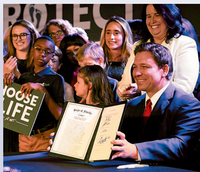
▲ 佛州州長德桑蒂斯或成為特朗普競爭對手。