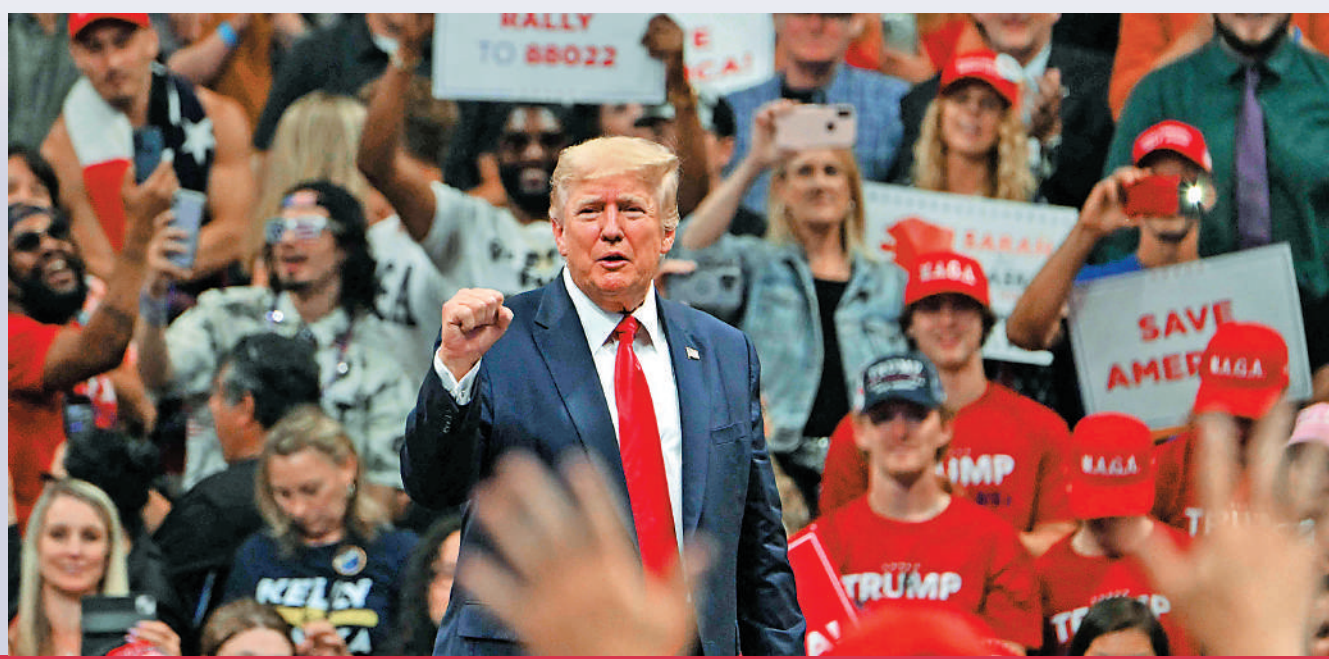
▶ 特朗普開始備戰 2024 年大選，圖為特朗普9日參加政治集會。