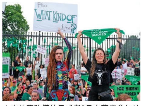
▲ 支持墮胎權的示威者9日在華府參加抗議活動。

【大公報訊】據美聯社報道：美國最高法院上月推翻「羅訴韋德案」後，聯邦政府與各州之間的墮胎權爭議持續