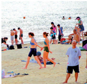
▲高空反氣旋為華南帶來普遍晴朗炎熱的天氣，圖為市民在黃金海岸泳灘游泳。

下周六「大暑」，廿四節氣之中，代表一年最熱的節氣，預測高見攝氏35度，部分地區例如上水、打鼓嶺有機會再高一兩度。資料顯示，本港歷來最熱的「大暑」在1972年，當日最高溫攝氏34.7度。