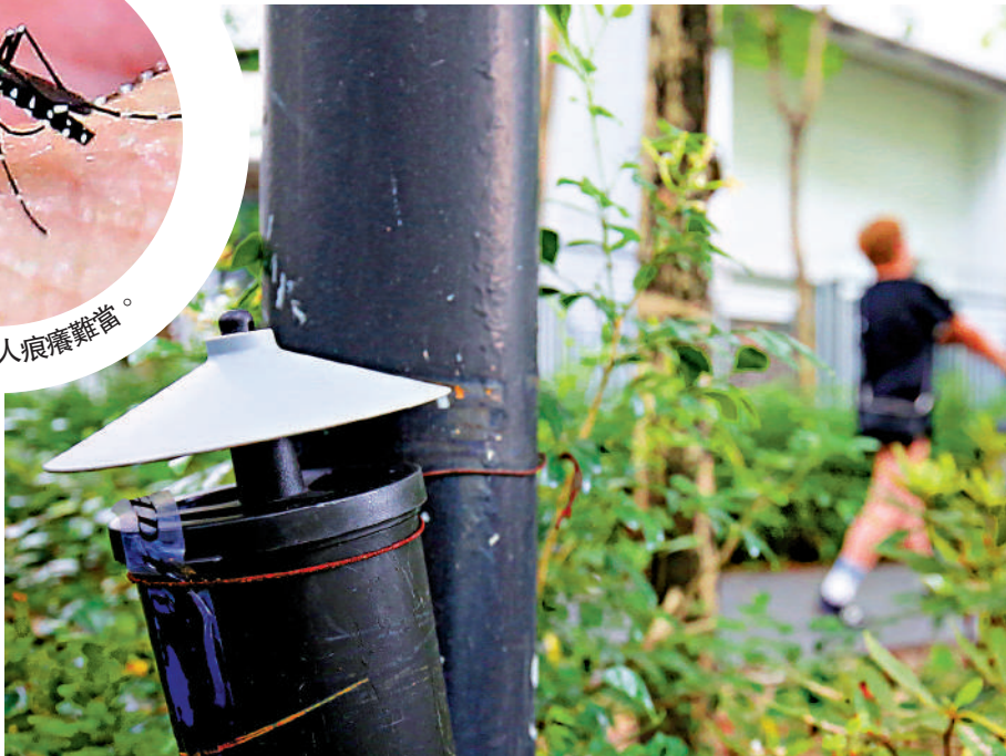
▲藍田偉發道麗港公園多處地方安裝了滅蚊器。