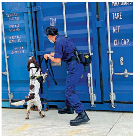
▲領犬員正在訓練搜查犬偵緝煙草的能力。

第二，因部分地區的通脹率上升，私煙集團於是趁機囤積私煙，確保黑市市場供應穩定及維持議價能力。海關表示會密切注意私煙集團的運作方式及走私手法，並作出適當部署，繼續全方位多角度打擊私煙活動。