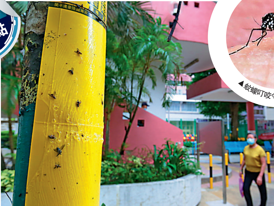
▲翠屏邨公園的捕蚊黏紙上布滿蚊屍。