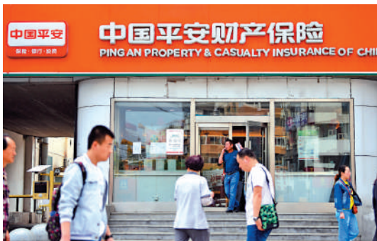
▲天災難料，中國財險近年在車險產品更多投向家庭自用車的客戶群，從而改善業務質素。

天風證券認為，中國財險核心車險業務迎來量質回升，非車險持續改善。中國財險對應2022年市賬率為0.69倍，對應股息率高達6%，短期數據持續驗證+長期向上復甦顯現，看好後續估值修復至0.8至1倍市賬率區間。