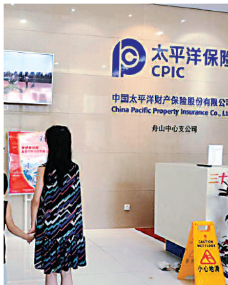
▲分析保險公司的財險業務，必須著重綜合成本率。

資收益，所以只要可投資的資產逐年遞增，即使投資收益率持平，每年盈利仍有機會增長。中國財險去年淨投資收益率下降0.1個百分點至3.5%，但淨投資收益不跌反升1.6%至179億元，因總投資資產按年增加5%至5340億元。