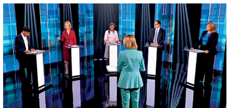
▶英國保守黨黨魁候選人17日參加第二輪電視辯論。