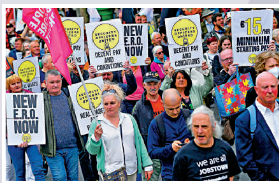
▲歐洲通脹高企，愛爾蘭民眾6月抗議生活成本上升。