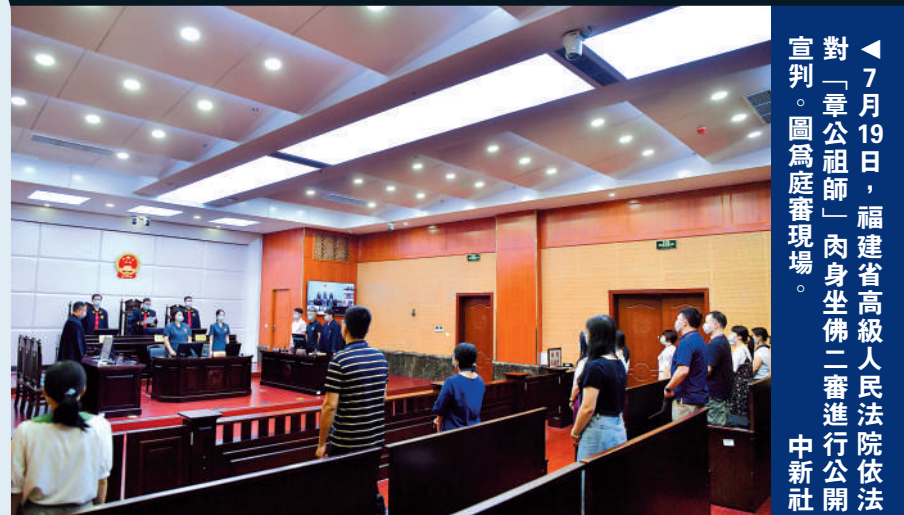
▲7月19日，福建省高級人民法院依法對「章公祖師」肉身坐佛二審進行公開宣判。圖為庭審現場。