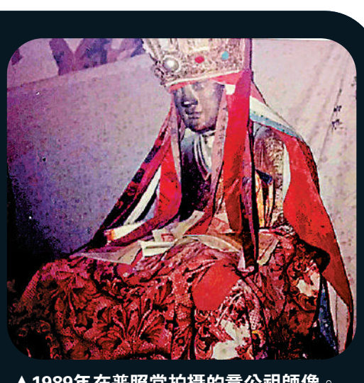
▲1989年在普照堂拍攝的章公祖師像。