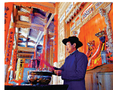
▲「章公祖師」像反映閩南傳統習俗。圖為村民供奉崇拜的信物。

北京匯祥律師事務所合夥人律師焦景收表示，對於海外流失文物，只要能夠確認文物為中國的民事主體所享有，就可以依據上述規定進行追索。在此案中，福建省大田縣陽春村和東埔村兩個村的村民就是章公祖師金身佛像的所有權人。佛像被盜後，有證據證明匈牙利自然科學博物館展出的佛像就是被盜的章公祖師金身佛像。故此，依照《物權法》的規定，權利人有權起訴追索遺失物，法院依法判決被告向原告即章公祖師佛像的所有權人返還章公祖師佛像，於法有據，合理合法，為中國追索海外流失文物提供極為重要的判例依據。